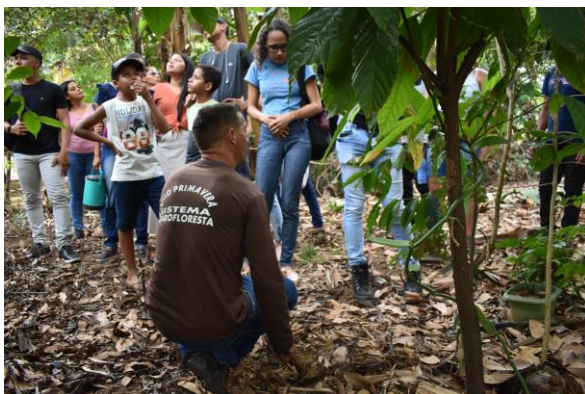
Figura 05 – Visão da cobertura do solo

Foi realizada uma visita na área, cujo estágio de desenvolvimento do sistema mais avançado. Os visitantes puderam observar na cobertura do solo, uma serapilheira que enriquece significativamente com a matéria orgânica, que traz inúmeros benefícios, conforme ( Figura 05 ). No mesmo local a partir de um outro olhar foi possível comprovar a composição dos estratos vegetais diversificado, com a composição de diversas espécies nativas e frutíferas ( Figura 06 ).