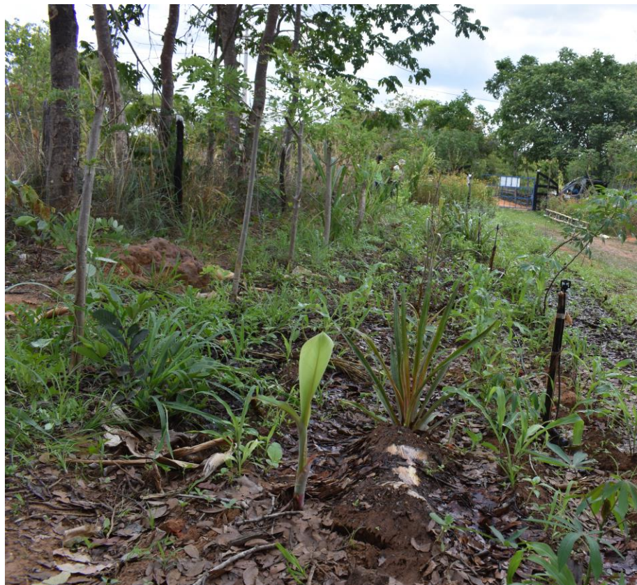
Figura 03 - Amostra de um talhão recém implantado

Fez-se uma parada em uma área nova recém implantado com culturas temporárias, bananeira e plantas dobadeiras. Podendo ser observado ( Figura 03 ) a cobertura do solo que contribuirá decisivamente nesse processo inicial de desenvolvimento das culturas.