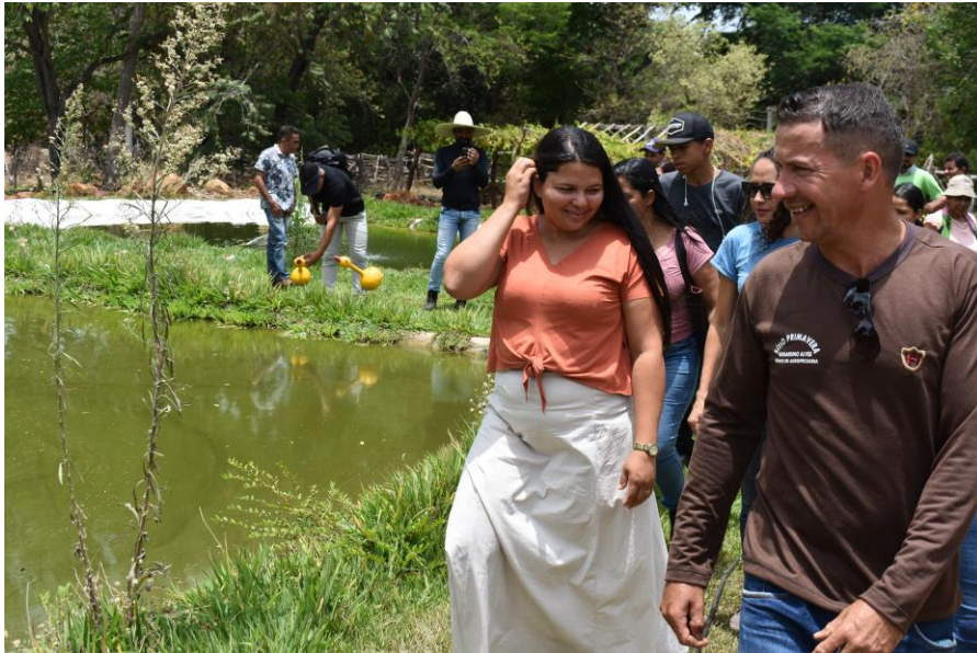
Figura 02 - Sistema de criação de peixes e reutilização da água.

Em seguida foi realizada a visita em campo com alguns pontos de parada nas diferentes implantações e em diferentes estágios de desenvolvimento: