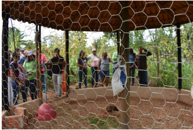
Figura 07 – Sistema PAIS

Foi visitado também nessa unidade produtiva, um sistema PAIS e formato mandala que foi implantado visando a diversificação da produção, na qual inclui a criação de aves que faz aproveitamento dos restos de hortaliças e fornece adubação orgânica para o sistema produtivo