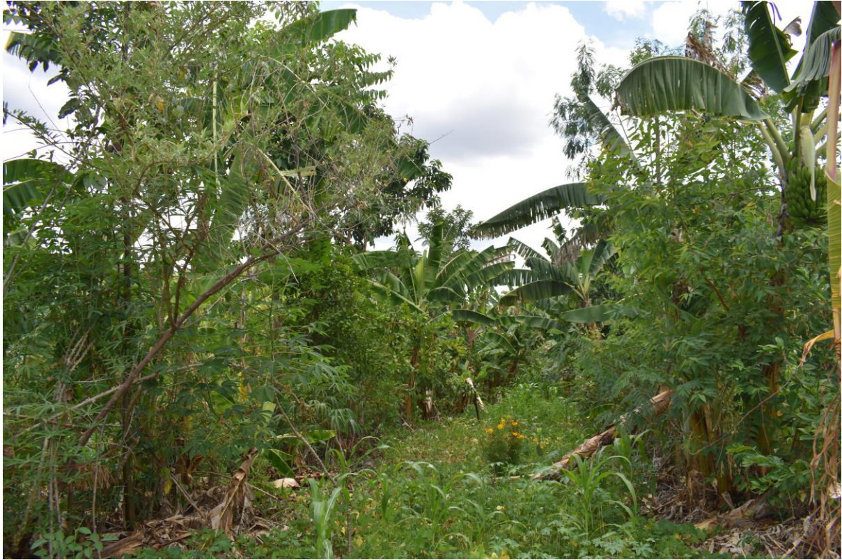
Figura 04 - Vista a uma área do SAF em estágio de desenvolvimento.

Dando continuidade ao percurso passou pelo espaço de cultivo já estabelecido, onde foi possível ver o sistema em estágio de desenvolvimento intermediário, tendo em sua composição as culturas temporárias anda em meio ao cultivo perene, conforme ilustra a Figura 04 .