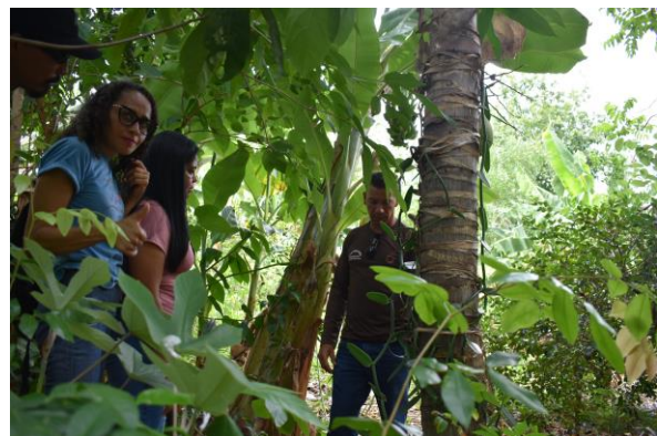
Figura 06 – Vistas dos estratos vegetais