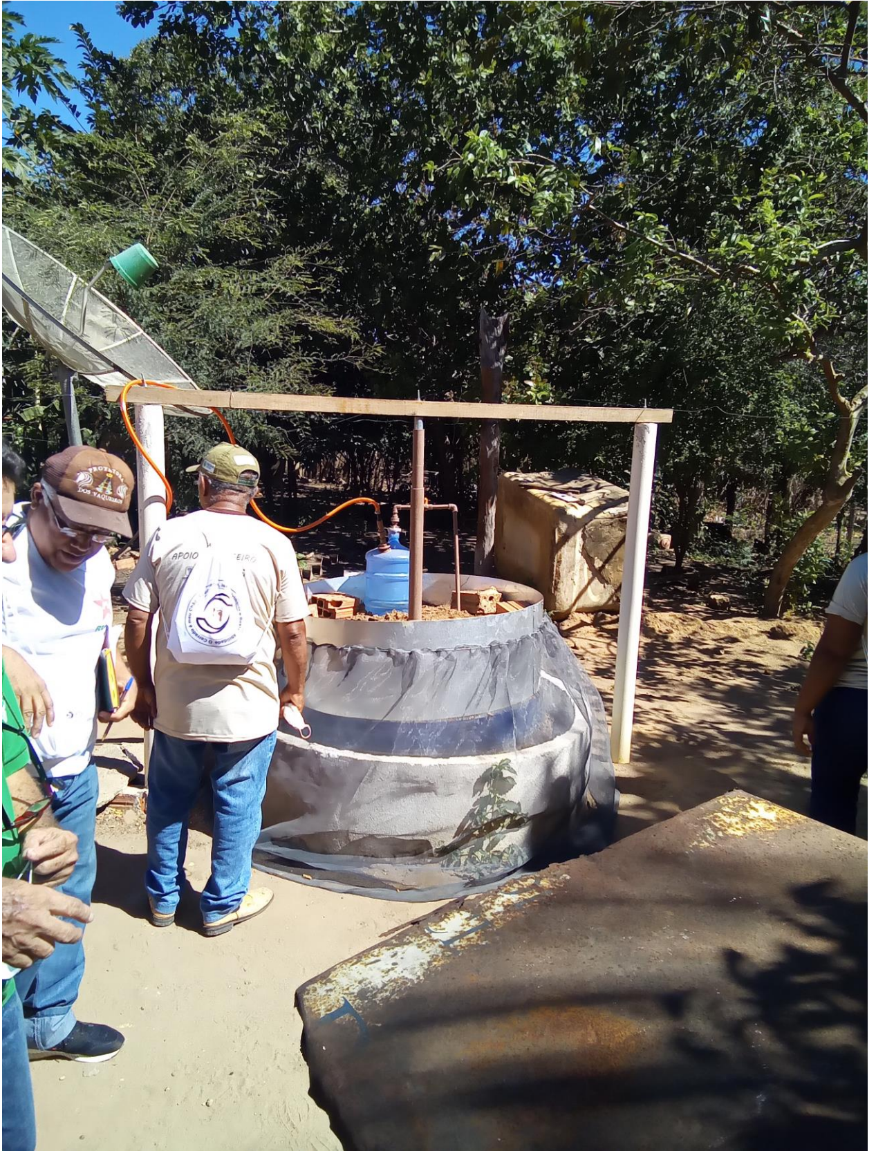
Biodigestor em Amarante Piauí