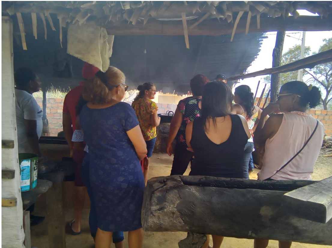
Fazendo as rapaduras e batidas de caju