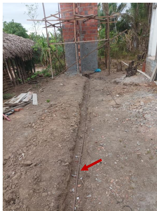
Figura 5 TUBOS DE PVC, SOLDÁVEL, ÁGUA FRIA, DN 20 MM - ALIMENTAÇÃO