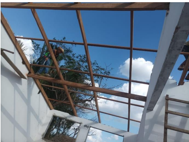
Figura 20 TRAMA DE MADEIRA COMPOSTA POR TERÇAS PARA TELHADOS DE ATÉ 2 ÁGUAS PARA TELHA ESTRUTURAL DE FIBROCIMENTO, INCLUSO TRANSPORTE VERTICAL.