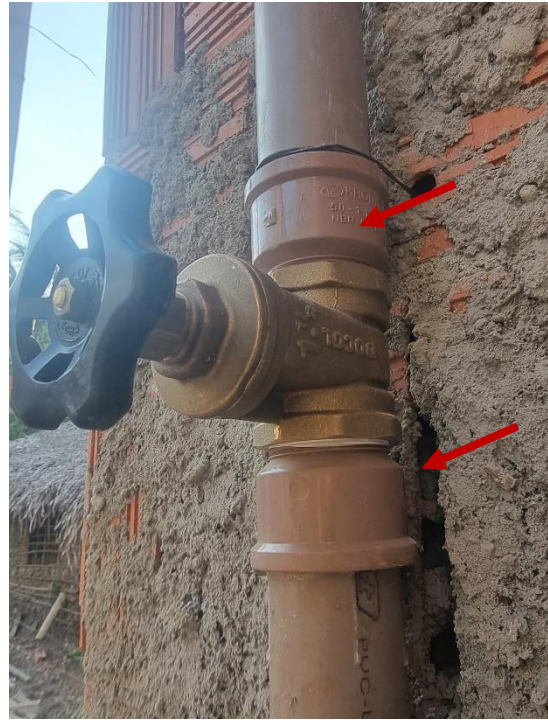
Figura 12 - ADAPTADOR CURTO COM BOLSA E ROSCA PARA REGISTRO 1 ½