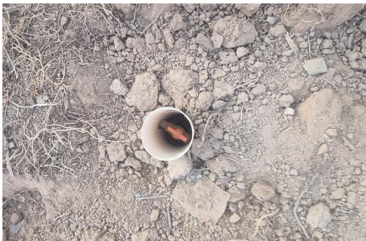
Figura 13 REGISTRO DE ESFERA, PVC, ROSCÁVEL, COM VOLANTE, 3/4