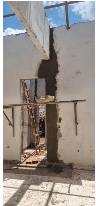
Figura 28 MASSA ÚNICA, PARA RECEBIMENTO DE PINTURA, EM ARGAMASSA