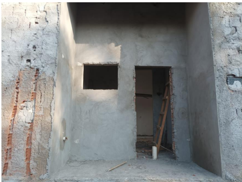
Figura 26 MASSA ÚNICA, PARA RECEBIMENTO DE PINTURA, EM ARGAMASSA