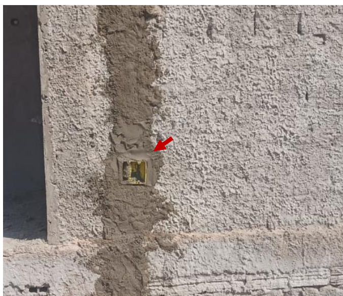
Figura 15 6 CAIXA RETANGULAR 4" X 4" BAIXA (0,30 M DO PISO)