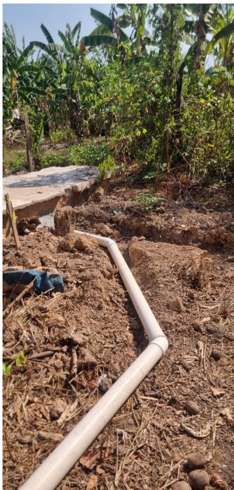
Figura 3 TUBO PVC, SÉRIE N, ESGOTO PREDIAL, 100 MM