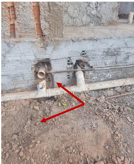
Figura 8 TUBOS DE PVC, SOLDÁVEL, ÁGUA FRIA, DN 25 MM - DISTRIBUIÇÃO