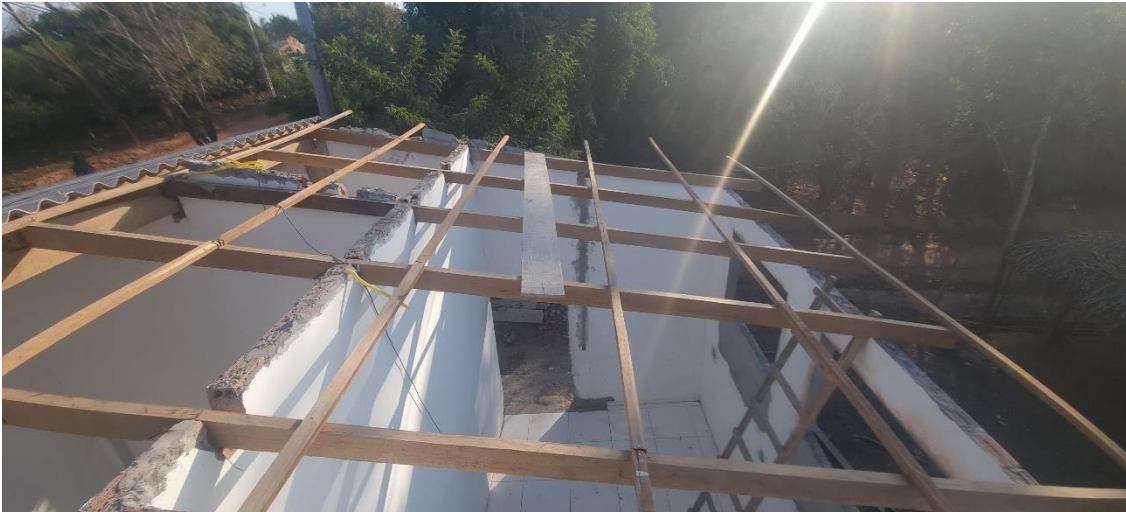
Figura 17 TRAMA DE MADEIRA COMPOSTA POR TERÇAS PARA TELHADOS DE ATÉ 2 ÁGUAS PARA TELHA ESTRUTURAL DE FIBROCIMENTO, INCLUSO TRANSPORTE VERTICAL.