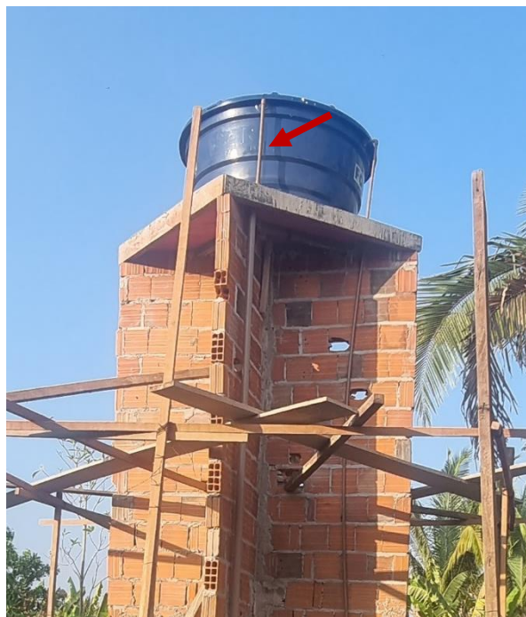
Figura 7 TUBOS DE PVC, SOLDÁVEL, ÁGUA FRIA, DN 25 MM - suspiro