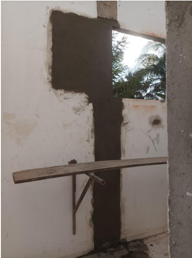
Figura 27 MASSA ÚNICA, PARA RECEBIMENTO DE PINTURA, EM ARGAMASSA