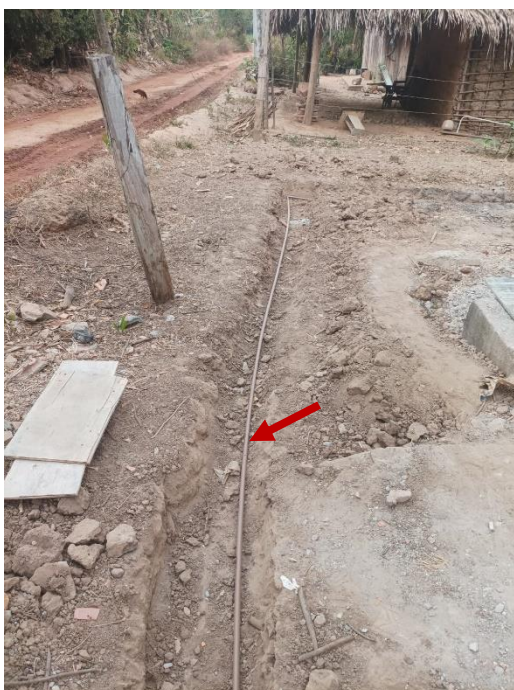
Figura 6 TUBOS DE PVC, SOLDÁVEL, ÁGUA FRIA, DN 20 MM - ALIMENTAÇÃO