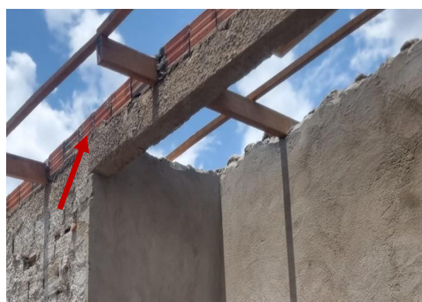
Figura 2 ALVENARIA DE VEDAÇÃO DE BLOCOS CERÂMICOS FURADOS NA HORIZONTAL DE 9X19X19 CM (ESPESSURA 9 CM)