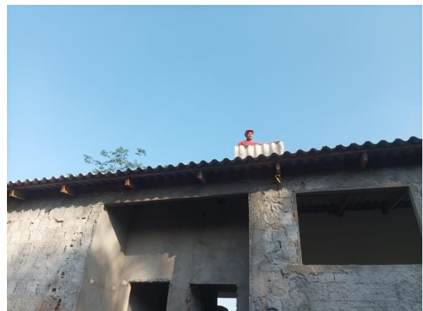
Figura 19 RECOLOCAÇÃO DE TELHA FIBROCIMENTO INCLUSO IÇAMENTO VERTICAL.