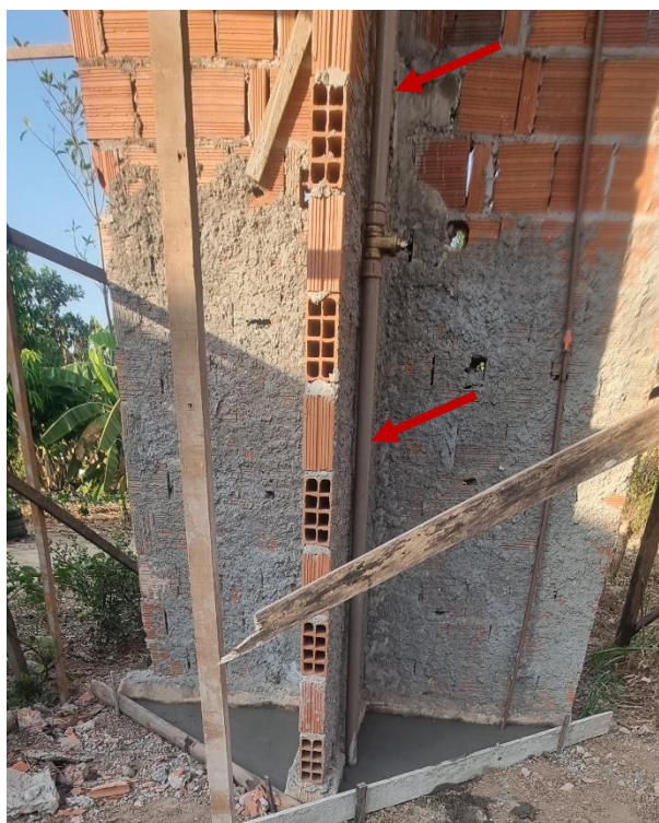
Figura 9 TUBOS DE PVC, SOLDÁVEL, ÁGUA FRIA, DN 50 MM