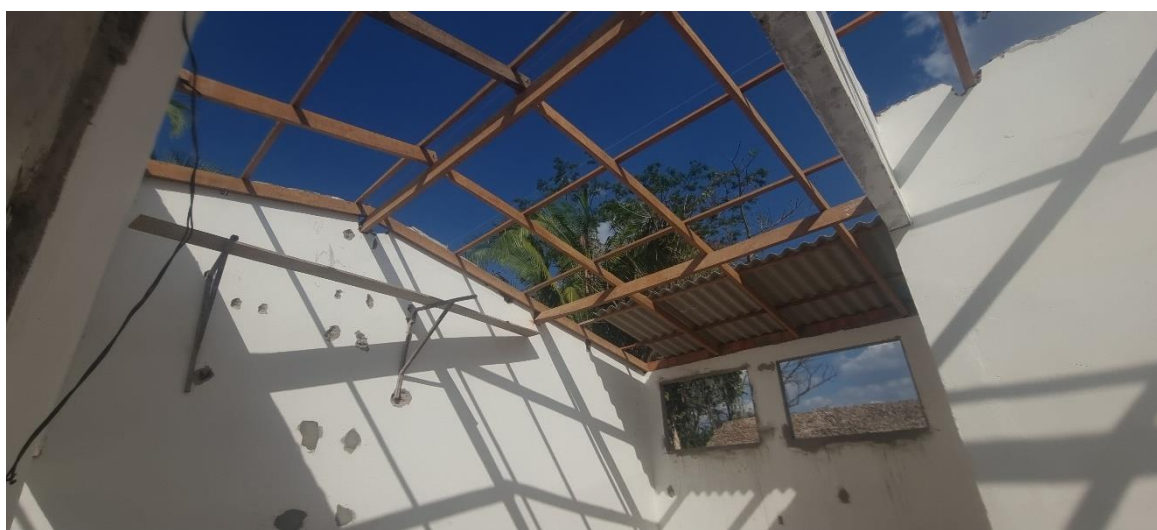
Figura 16 TRAMA DE MADEIRA COMPOSTA POR TERÇAS PARA TELHADOS DE ATÉ 2 ÁGUAS PARA TELHA ESTRUTURAL DE FIBROCIMENTO, INCLUSO TRANSPORTE VERTICAL.