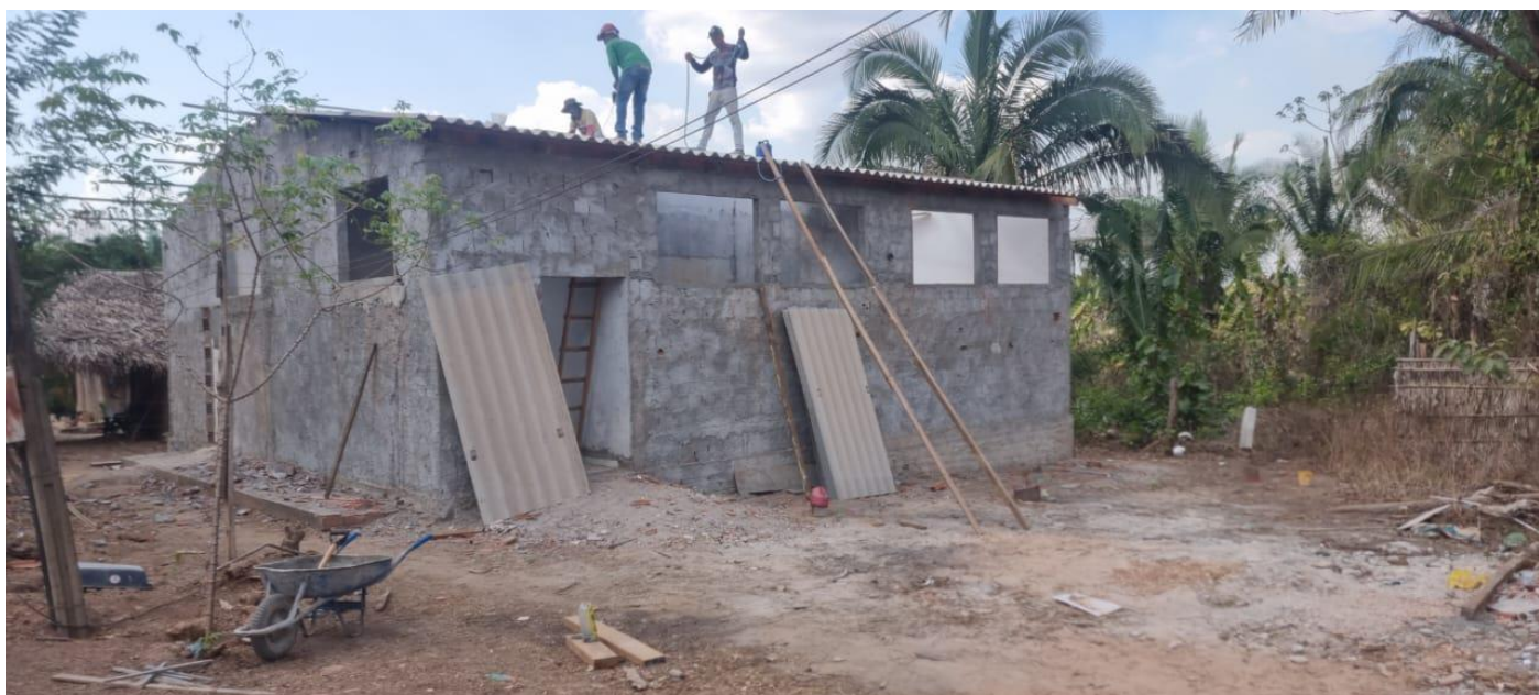
Figura 22. TELHAMENTO DA COMBERTURA UTILIZANDO A TELHA EXISTENTE.