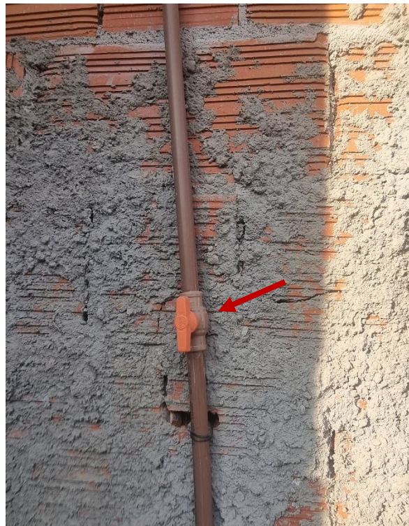
Figura 10 REGISTRO DE ESFERA, PVC, ROSCÁVEL, COM BORBOLETA, 1/2