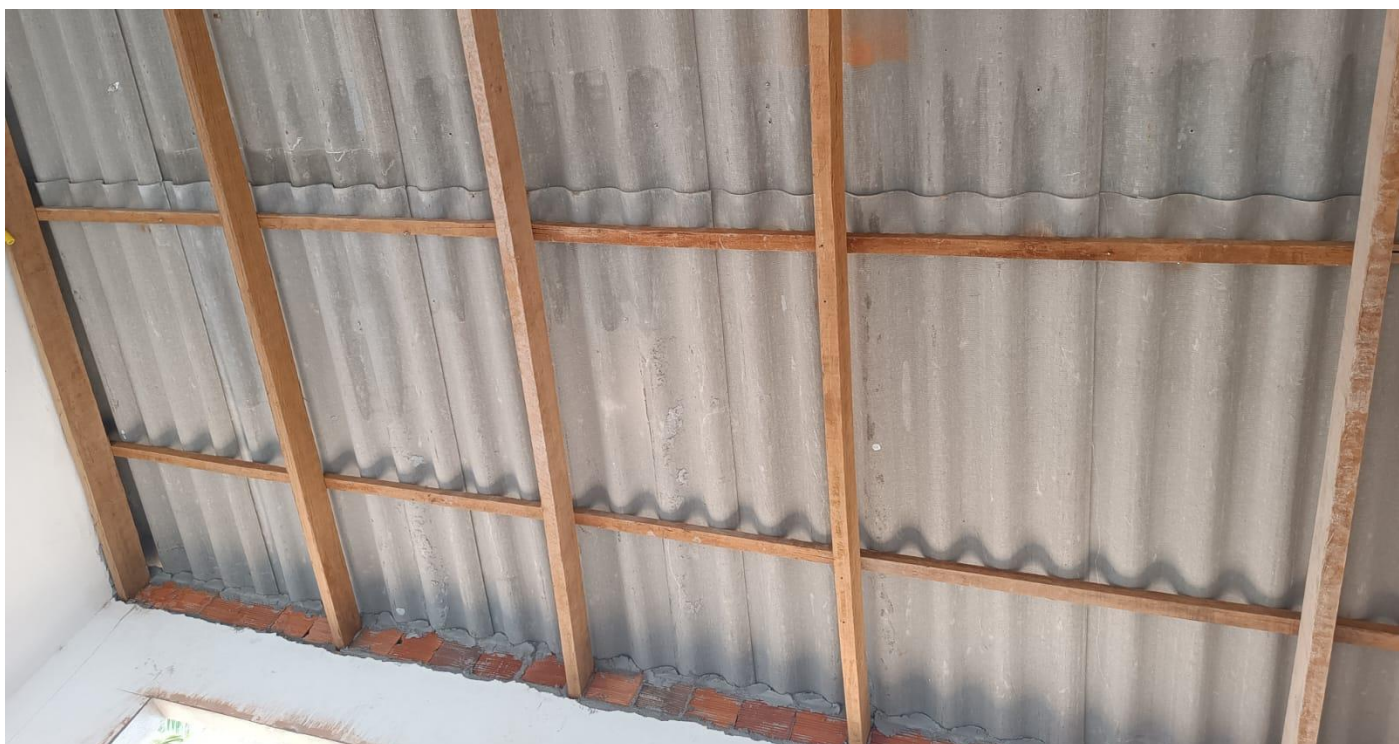
Figura 23. TRAMA DE MADEIRA E TELHA FIBROCIMENTO 110X366 COM ESPESURA DE 6 MM FINALIZADA, VISTA DO INTERIOR DO PRÉDIO.