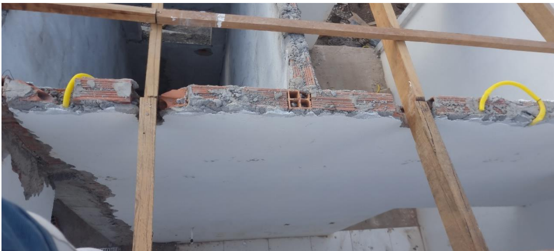
Figura 18 TRAMA DE MADEIRA COMPOSTA POR TERÇAS PARA TELHADOS DE ATÉ 2 ÁGUAS PARA TELHA ESTRUTURAL DE FIBROCIMENTO, INCLUSO TRANSPORTE VERTICAL.