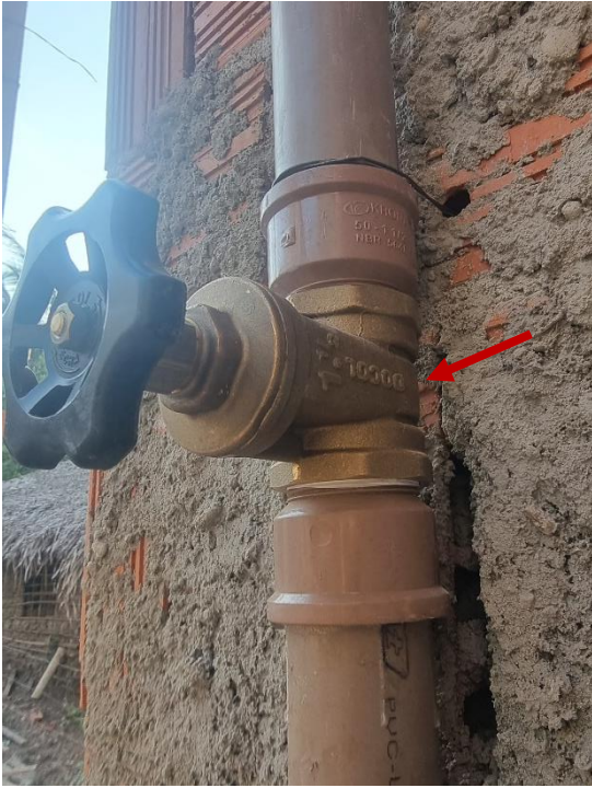
Figura 11 REGISTRO DE GAVETA BRUTO, LATÃO, ROSCÁVEL, 1 ½