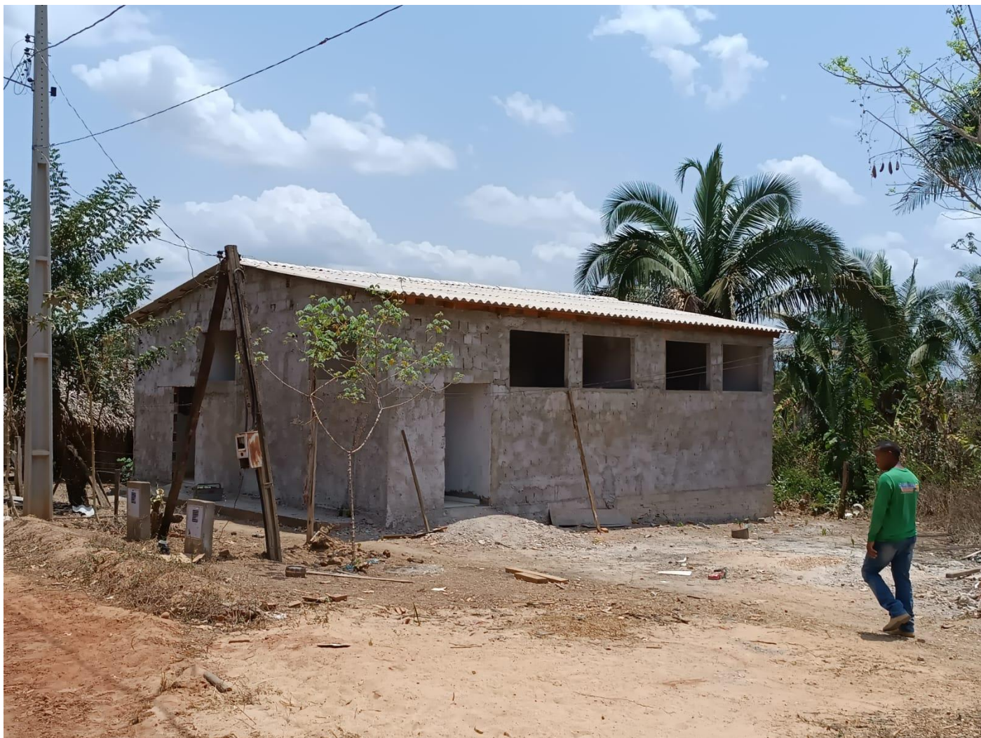
Figura 25. VISTA DO TELHADO FINALIZADO.