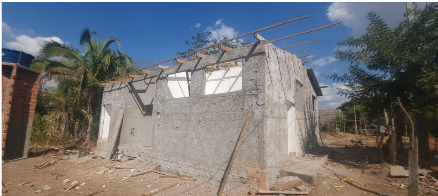
Figura 21. TRAMA DE MADEIRA EM EXECUÇÃO VISTA DA LATERAL.