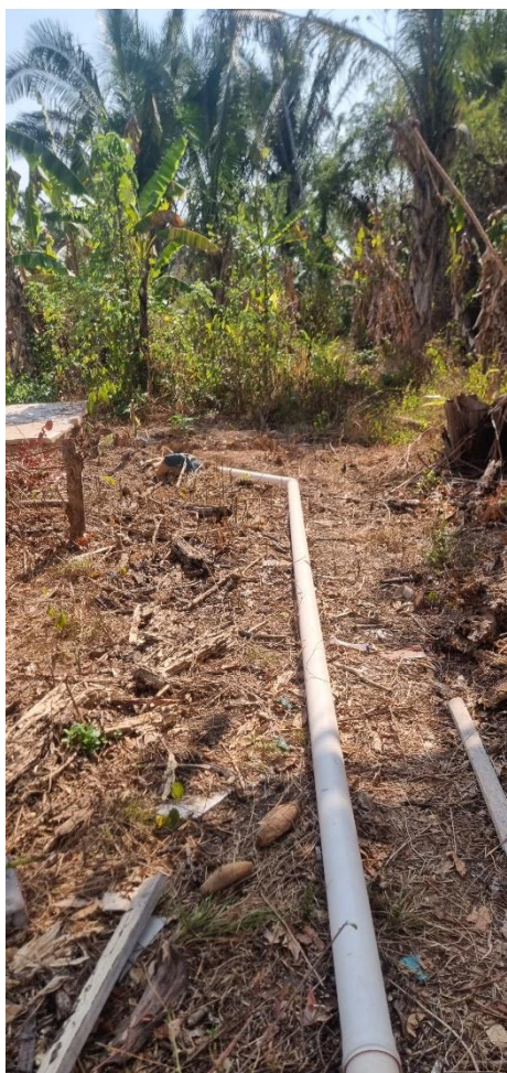
Figura 4 TUBO PVC, SÉRIE N, ESGOTO PREDIAL, 100 MM