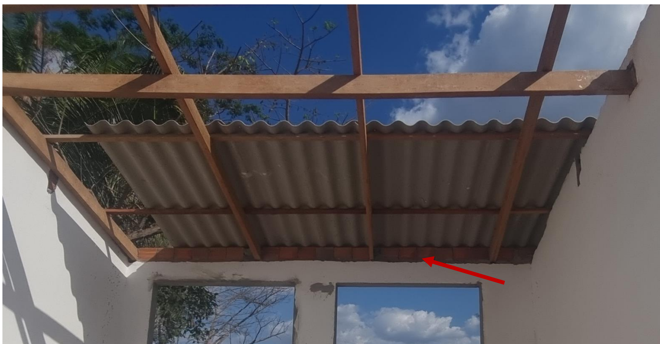
Figura 1 ALVENARIA DE VEDAÇÃO DE BLOCOS CERÂMICOS FURADOS NA HORIZONTAL DE 9X19X19 CM (ESPESSURA 9 CM)