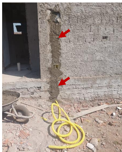
Figura 14 ELETRODUTO FLEXÍVEL CORRUGADO, PVC, DN 25 MM (3/4")