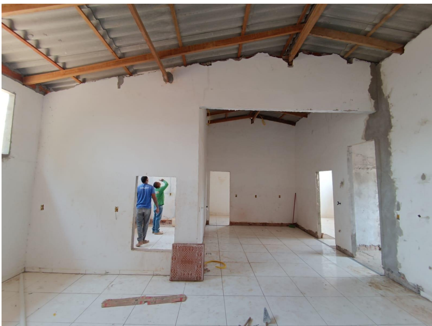
Figura 24. TRAMA DE MADEIRA EXECUTADA, TELHAMENTO FINALIZADO.