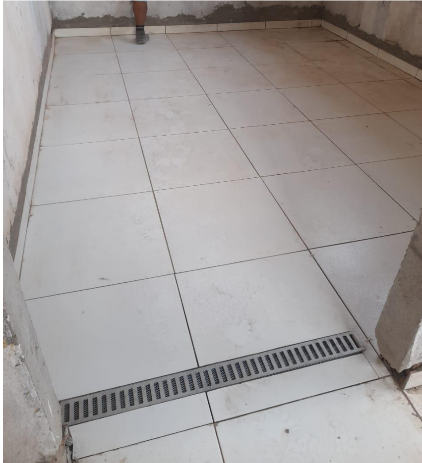
Figura 15 - PISO CERAMICO E RALO TIPO CANALETA COM TELA DE PROTEÇÃO ANTINCETO.