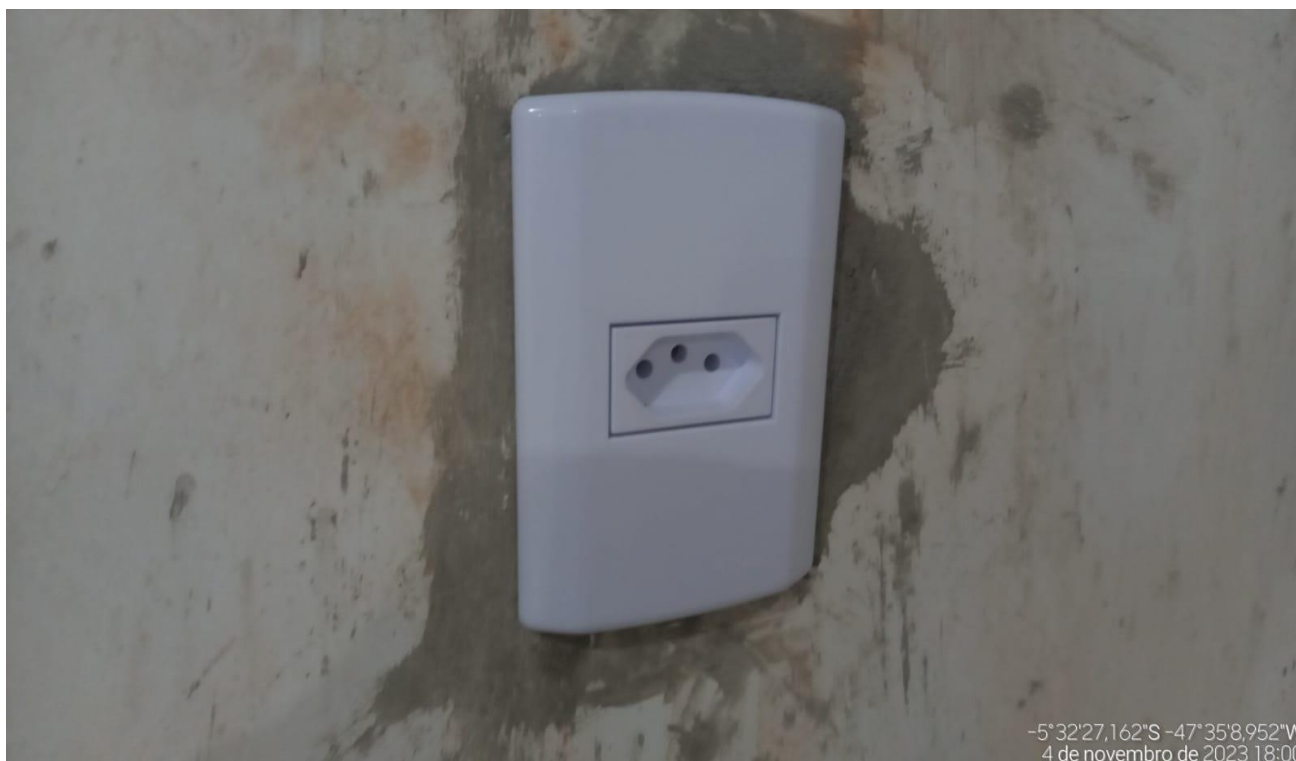
Figura 4 - TOMADA MÉDIA DE EMBUTIR (1 MÓDULO), 2P+T 10 A, INCLUINDO SUPORTE E PLACA - FORNECIMENTO E INSTALAÇÃO.