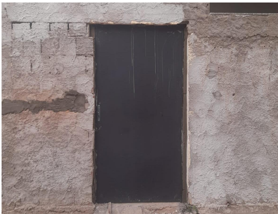
Figura 9 - PORTA DE AÇO EM CHAPA DUPLA LISA COM PROTEÇÃO EM ZARCÃO. FORNECIMENTO E INSTALAÇÃO.