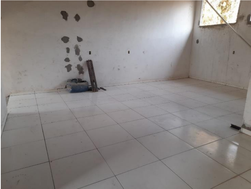
Figura 13 - ASSENTAMENTO DE PISO PORCELANATO, INCLUINDO ARGAMASSA, REJUNTE, CUNHAS E ESPAÇADORES E MÃO DE OBRA, (EXCLUSIVE PISO PORCELANATO) .