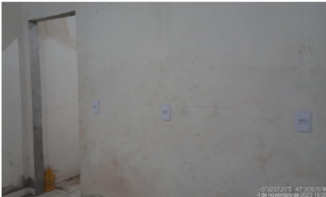
Figura 3 - TOMADA MÉDIA DE EMBUTIR (1 MÓDULO), 2P+T 10 A, INCLUINDO SUPORTE E PLACA - FORNECIMENTO E INSTALAÇÃO.