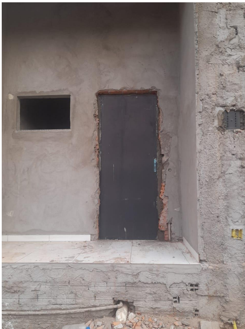
Figura 17. PORTA EM CHAPAS DE AÇO LISA DUPLA, ENTRADA PARA A BARREIRA SANITÁRIA.