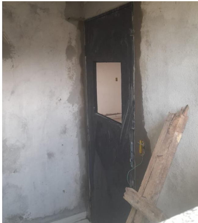
Figura 16 - PORTA EM CHAPAS DE AÇO LISA DUPLA COM ABERTURA PARA VIDRO.