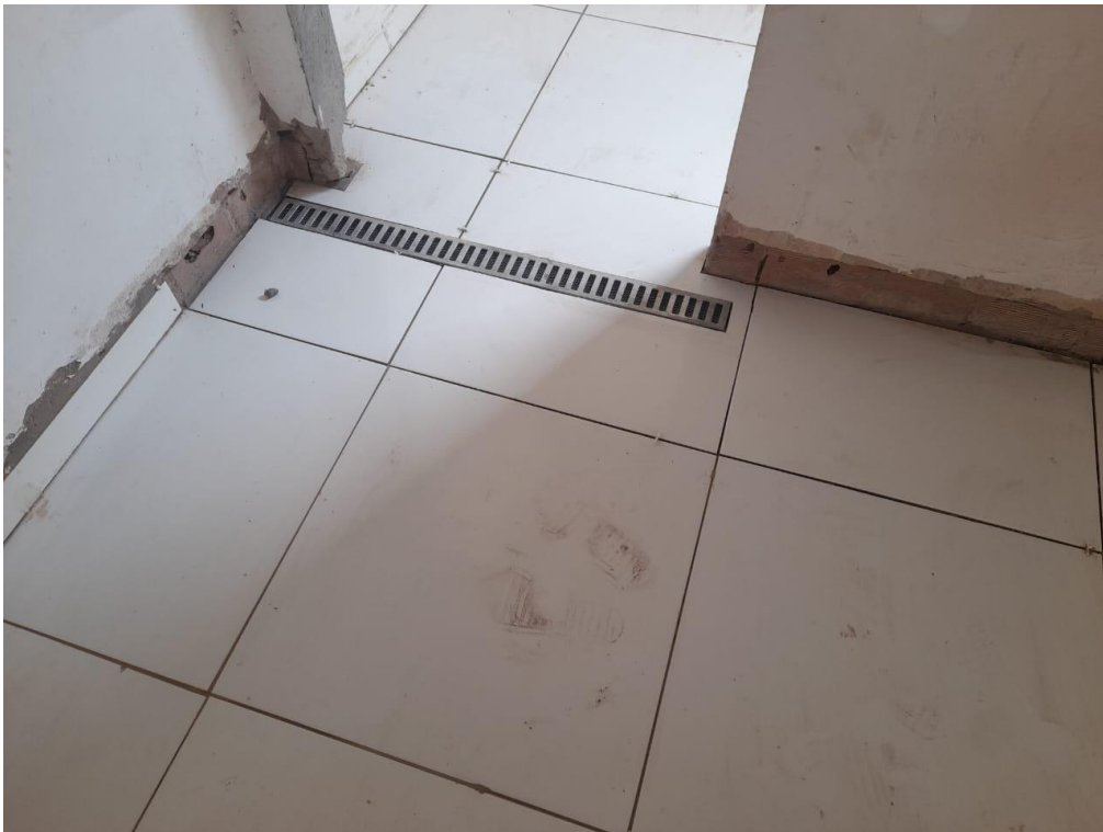
Figura 14 - PISO CERAMICO E RALO TIPO CANALETA COM TELA DE PROTEÇÃO ANTINCETO.