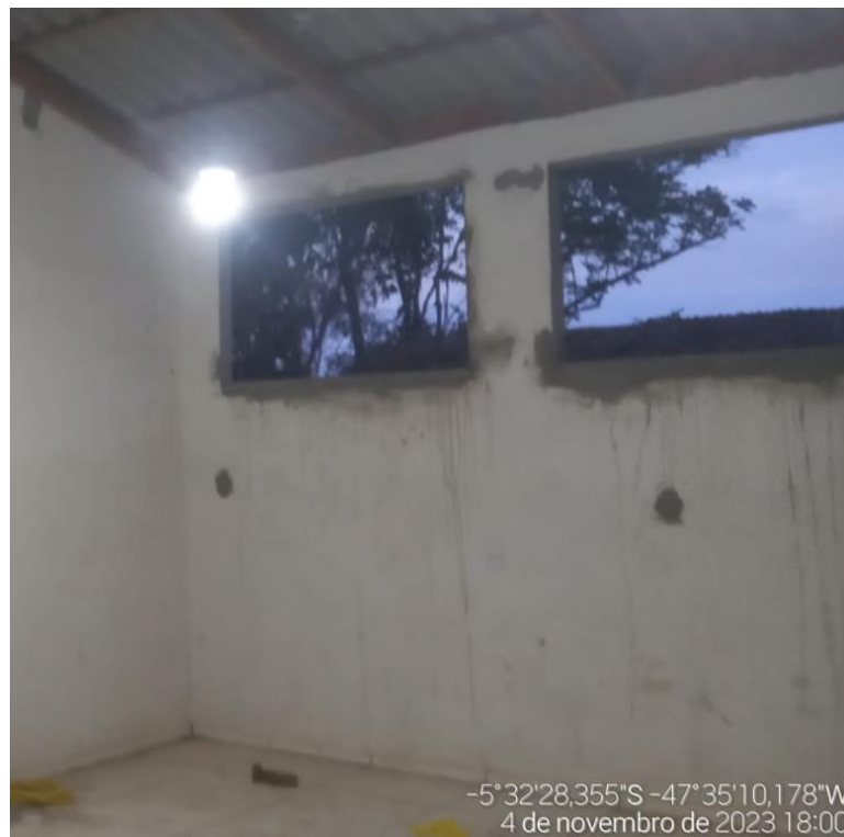
Figura 8 - LAMPADA DE LED 20 W 6500 K COM PLAFON PLASTICO. FORNECIMENTO E INSTALAÇÃO