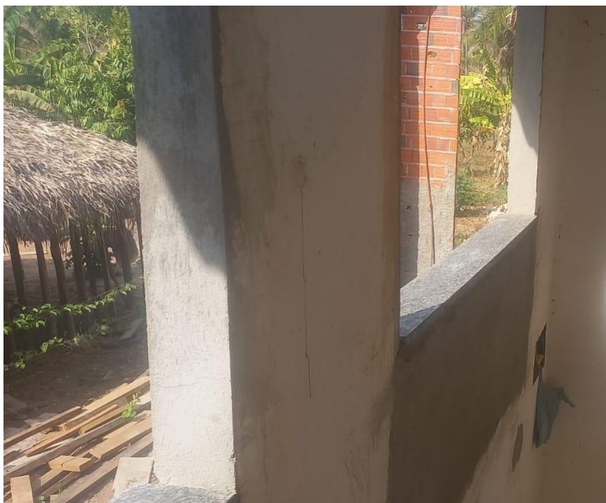
Figura 11 - Peitoril em granito cinza andorinha instalado em vãos de janelas, para recebimento de vidro temperado.