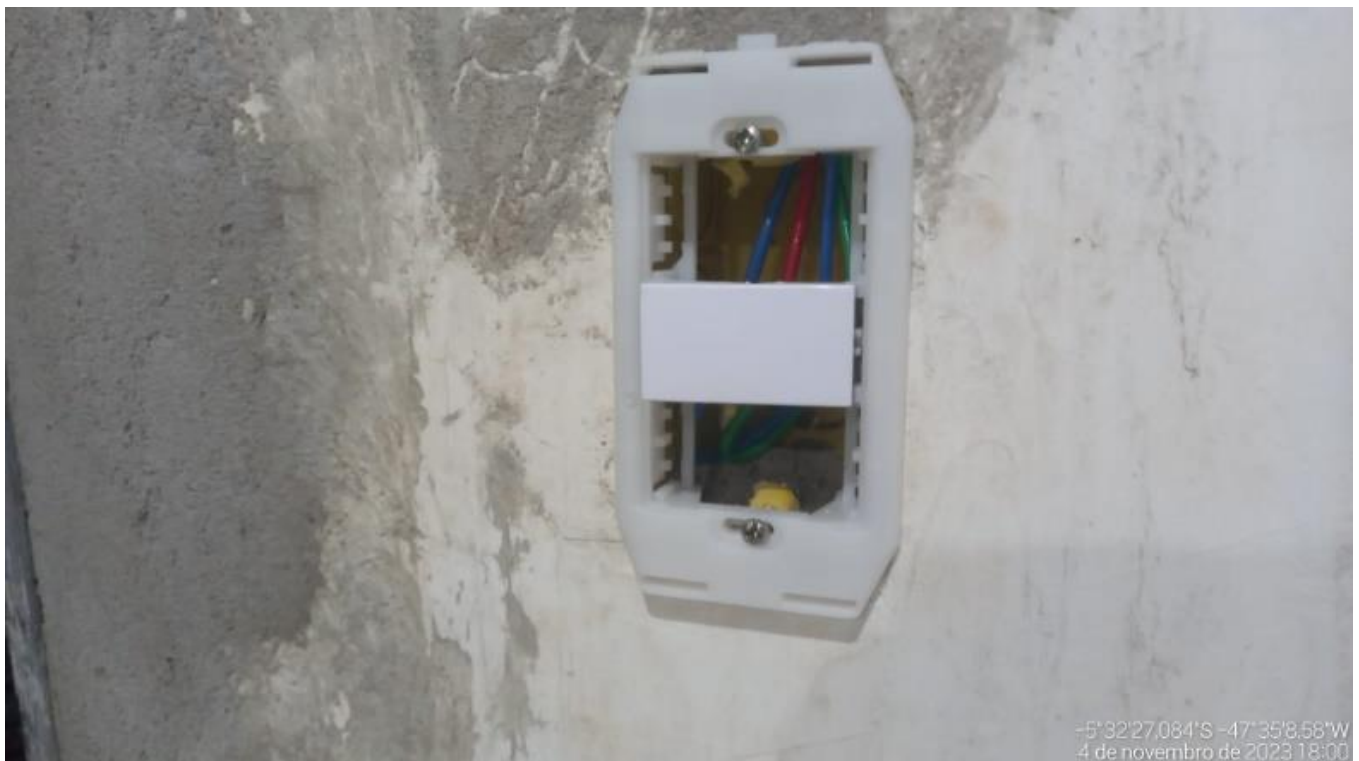
Figura 2 - Interruptor Simples, mód. 10A/ 250W, INCLUINSO SUPORTE E PLACA - FORNECIMENTO E INSTALAÇÃO.