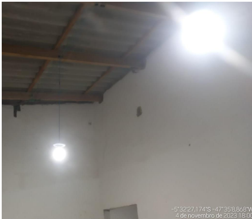
Figura 7 - Lampadas de 20W de led, instaladas em todos os ambientes.