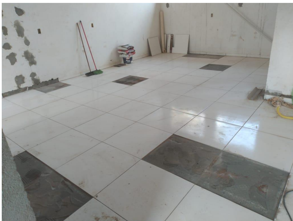
Figura 12 - ASSENTAMENTO DE PISO PORCELANATO, INCLUINDO ARGAMASSA, REJUNTE, CUNHAS E ESPAÇADORES E MÃO DE OBRA, (EXCLUSIVE PISO PORCELANATO).