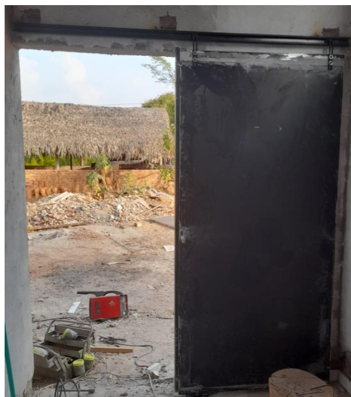
Figura 10 - PORTA DE AÇO EM CHAPA DUPLA LISA COM PROTEÇÃO EM ZARCÃO. FORNECIMENTO E INSTALAÇÃO.