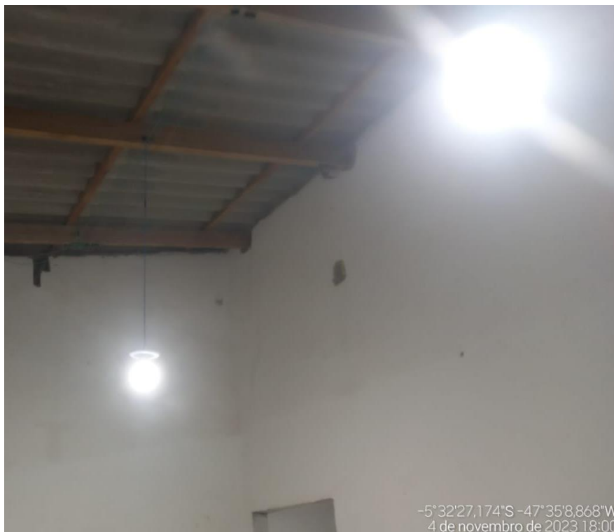
Figura 5 - LAMPADA DE LED 20 W 6500 K COM PLAFON PLASTICO. FORNECIMENTO E INSTALAÇÃO