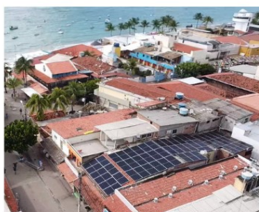
RESTAURANTE - PORTO DE GALINHAS