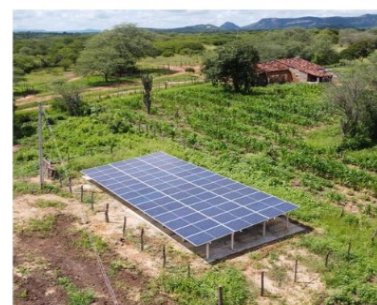
RURAL - FLORESTA-PE