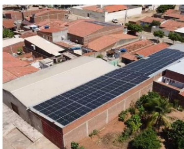
GALPÃO - FLORESTA-PE