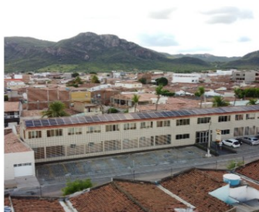
HOTEL Pousada da Serra - SERRA TALHADA-PE