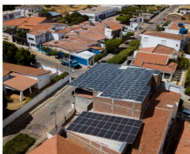
PANIFICADORA VILA BELA - SERRA TALHADA-PE