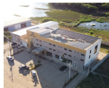
FELIPE HOTEL - SERRA TALHADA-PE