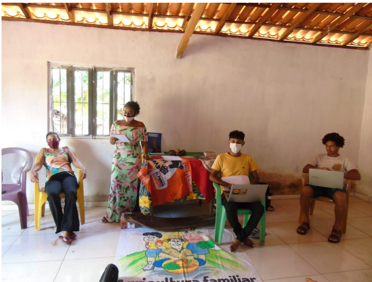
1 MOMENTO; mística de abertura (leitura do poema todas as vidas, de Cora Coralina e o pai nosso dos pobres marginalizados).