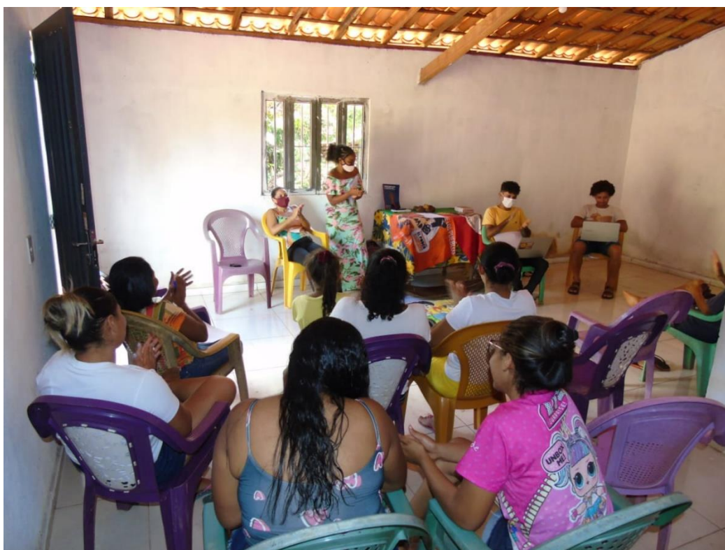
Em seguida, apresentação dos participantes, equipe executora e instituições proponentes.