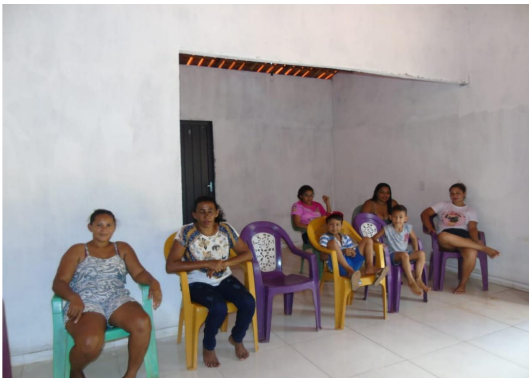
Sétimo momento: 15h00m às 15h20m as mulheres continuaram falando da rede de comercialização, que precisam de fortalecimento nessa área.