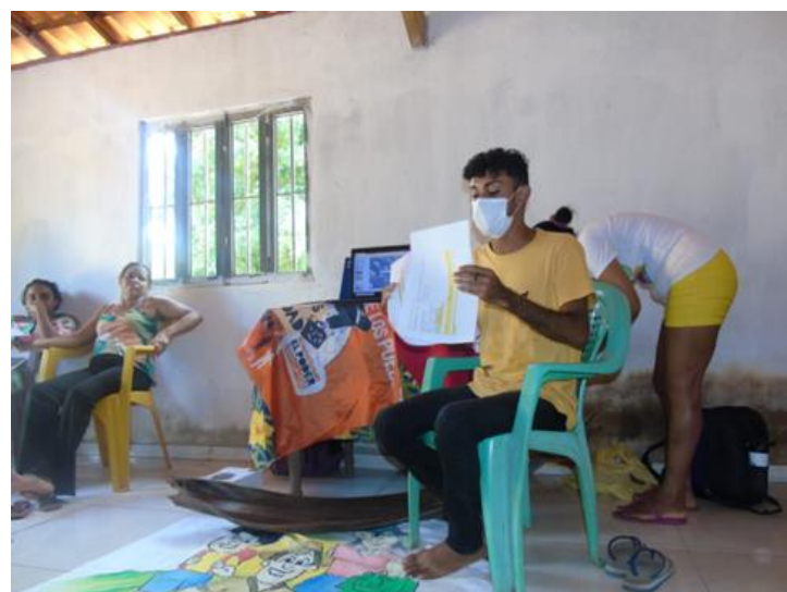
Segundo momento: 9h30m às 10h20m apresentação do projeto, objetivos e discussão acerca da contribuição do projeto para o processo organizativo das mulheres.