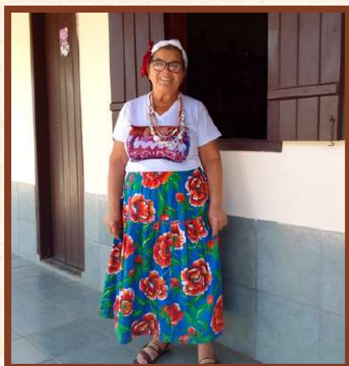
Participação em grupos culturais

Essa mulher de muitas facetas faz parte do grupo folclórico de tradição local “Resgate do Saber” já há aproximadamente 10 anos. Ela é também poetisa, sempre gostou de escrever poemas e versos que falam de seus sentimentos, sobre o campo, a vida em comunidade, a mulher e ao mesmo tempo poemas que denunciam os crimes e injustiças locais. Esse lado artístico cultural, empoderado e cheio de identidade é um dos elementos que a torna inspiradora.