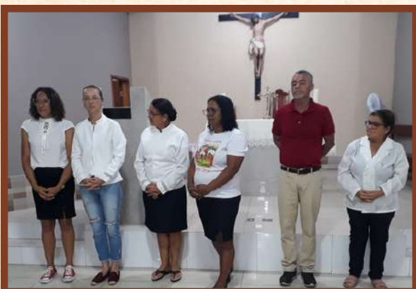
Colaboração na Igreja