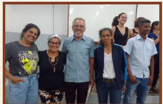
Participação ASA - Artic. do Semiárido