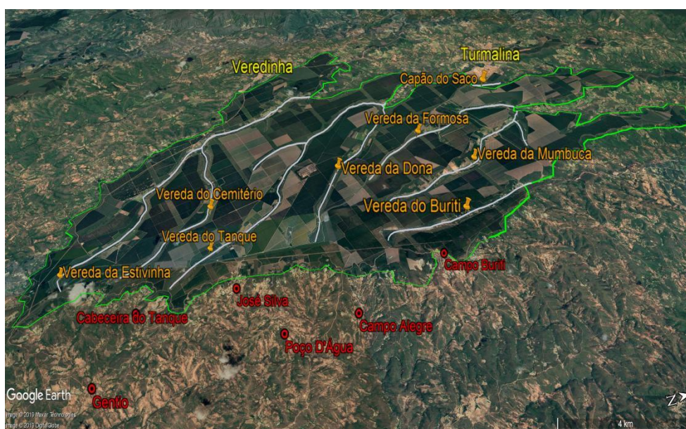
Figura 1 – Chapada da Veredas, 2019.

Fonte: Google Earth. Elaborado por Emília Pereira Fernandes da Silva, 2019.