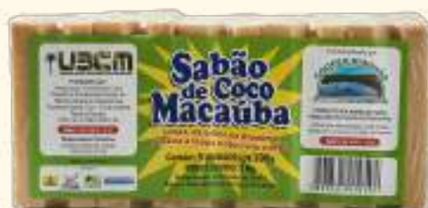
Sabão de Coco Macaúba 1kg