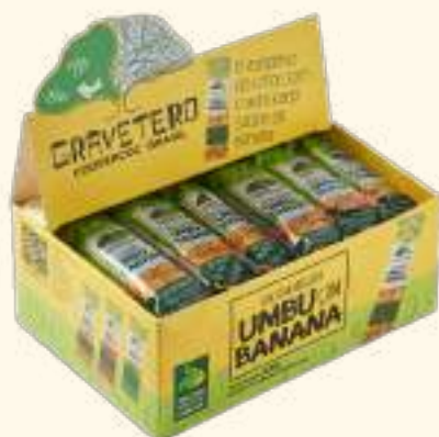
Doce em massa de umbu com banana 25g