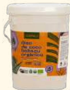
Óleo de coco babaçu orgânico 3,3L