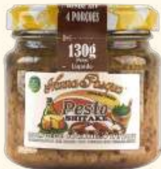
Pesto cogumelo shitake 130g