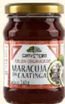
Geleia orgânica de maracujá da Caatinga 240g