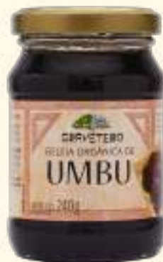
Geleia orgânica de umbu 240g