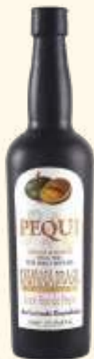
Licor de Pequi 700ml