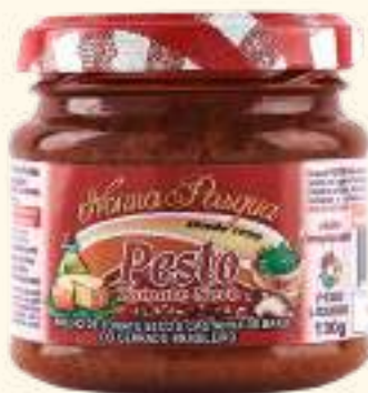
Pesto tomate seco 130g