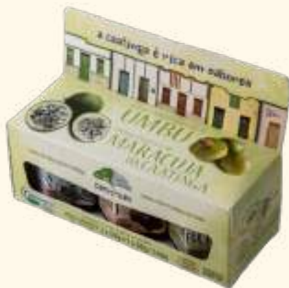
Kit de geleias da Caatinga 142g