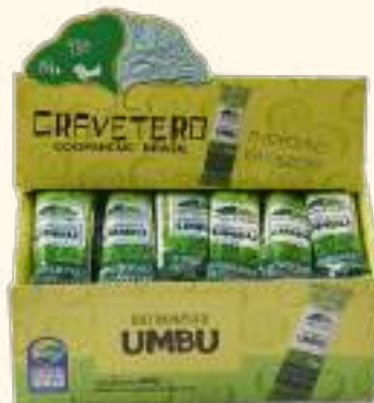
Doce em massa de umbu 25g