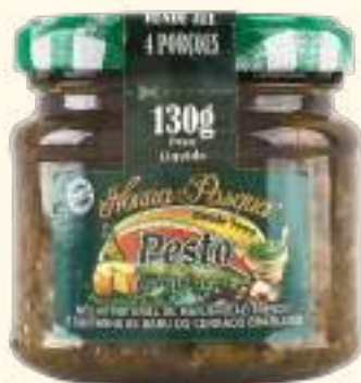
Pesto manjeriçao 130g