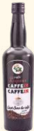
Licor de café 700ml