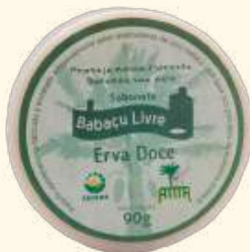
Sabonete Babaçu Livre - Erva Doce 90g