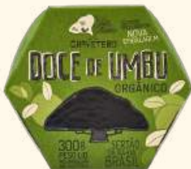
Doce de umbu 300g