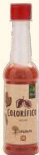
Urucum (colorífico) 100g