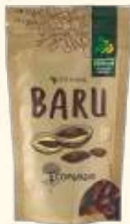
Castanha de Baru torrada sem sal 100g