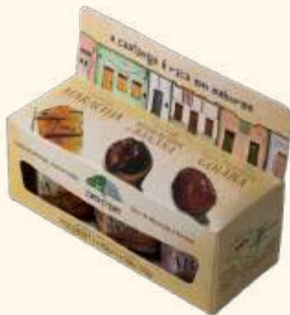
Kit de geleias do Brasil 142g