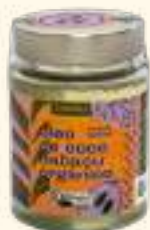
Óleo de coco babaçu orgânico 350 ml