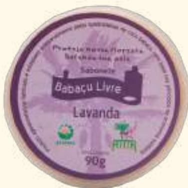
Sabonete Babaçu Livre - Lavanda 90g