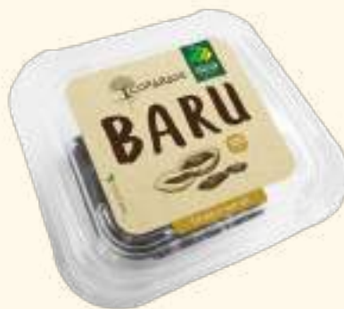
Castanha de Baru torrada sem sal 120g