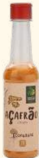
Açafrão (cúrcuma) 70g