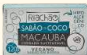
Sabão de Coco Macaúba 120g