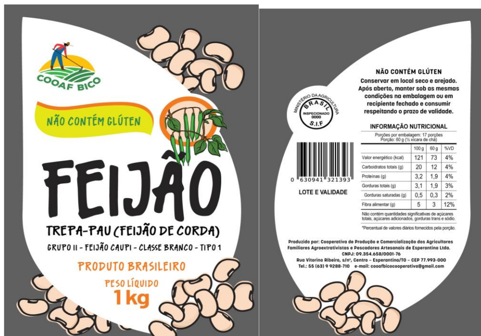
Rótulo do feijão da COOAF, (Fonte: Terrapilheira, 2023)