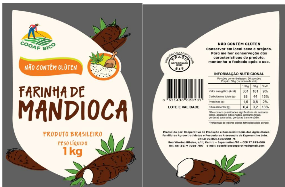
Rótulo da farinha de mandioca da COOAF, (Fonte: Terrapilheira, 2023)