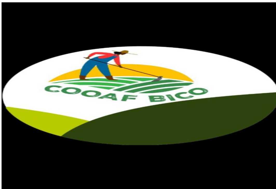
Logo da COOAF-BICO, (Fonte: Terrapilheira, 2023)