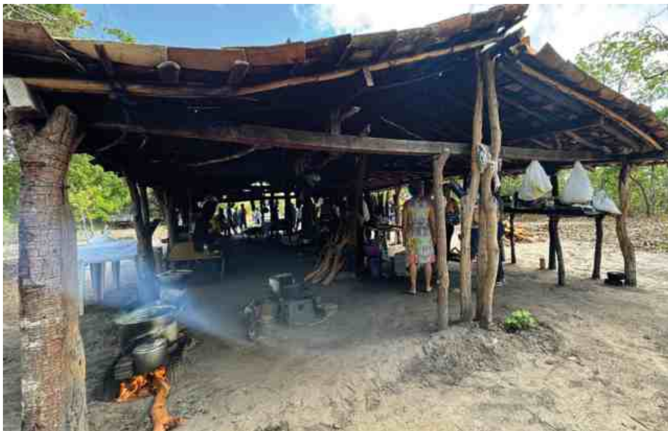
Rancho no território de Fecho de Pasto de Porcos, Guará e Pombas, Correntina (BA).

diante dos danos causados pela ação humana. Para isso, sugere-se a elaboração coletiva de um inventário da realidade, envolvendo escola e comunidade, a fim de destacar as riquezas locais e reforçar sua importância para o território e para o planeta. A seguir, apresentam-se referências metodológicas para a elaboração desse inventário.