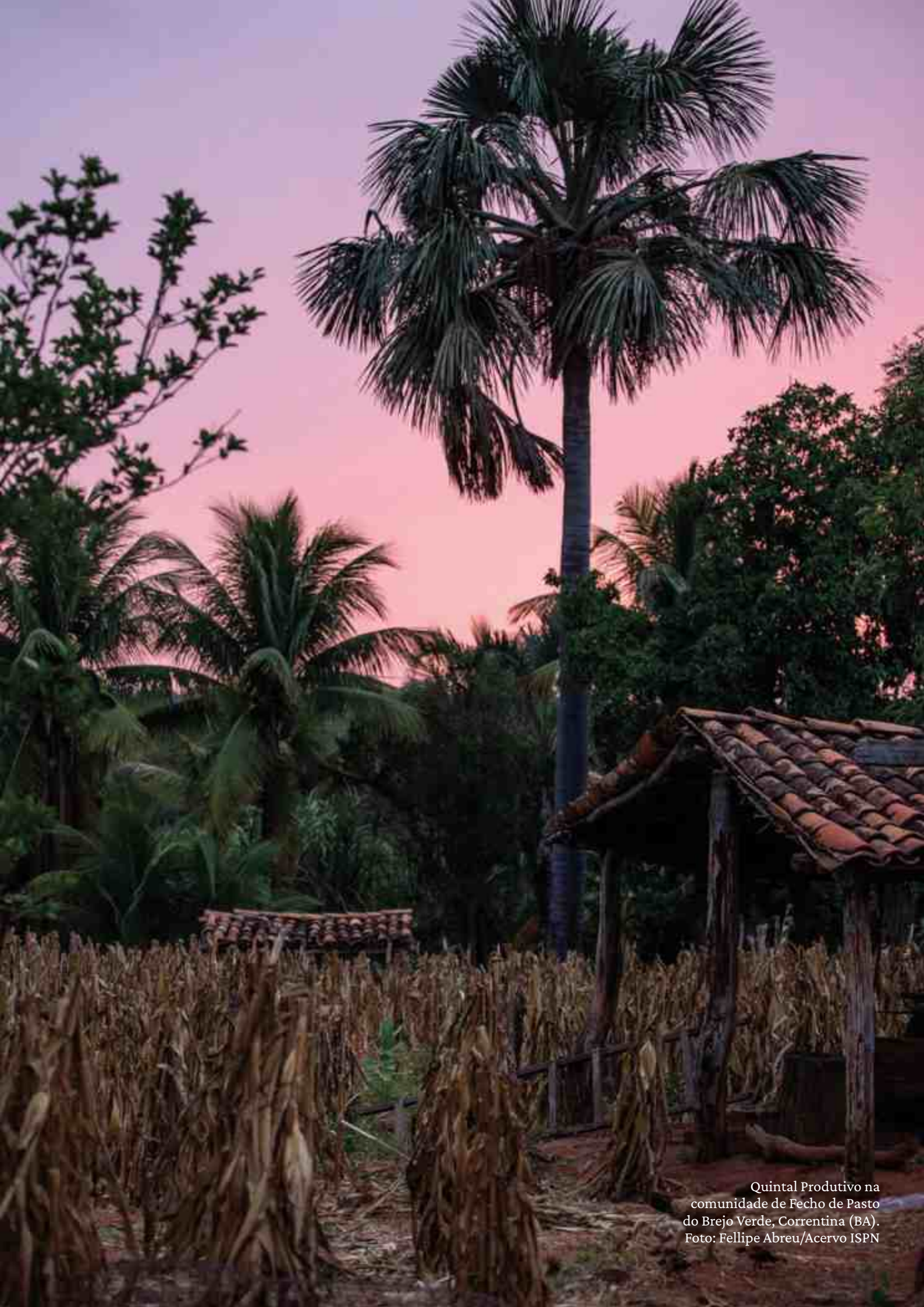
Quintal Produtivo na comunidade de Fecho de Pasto do Brejo Verde, Correntina (BA).