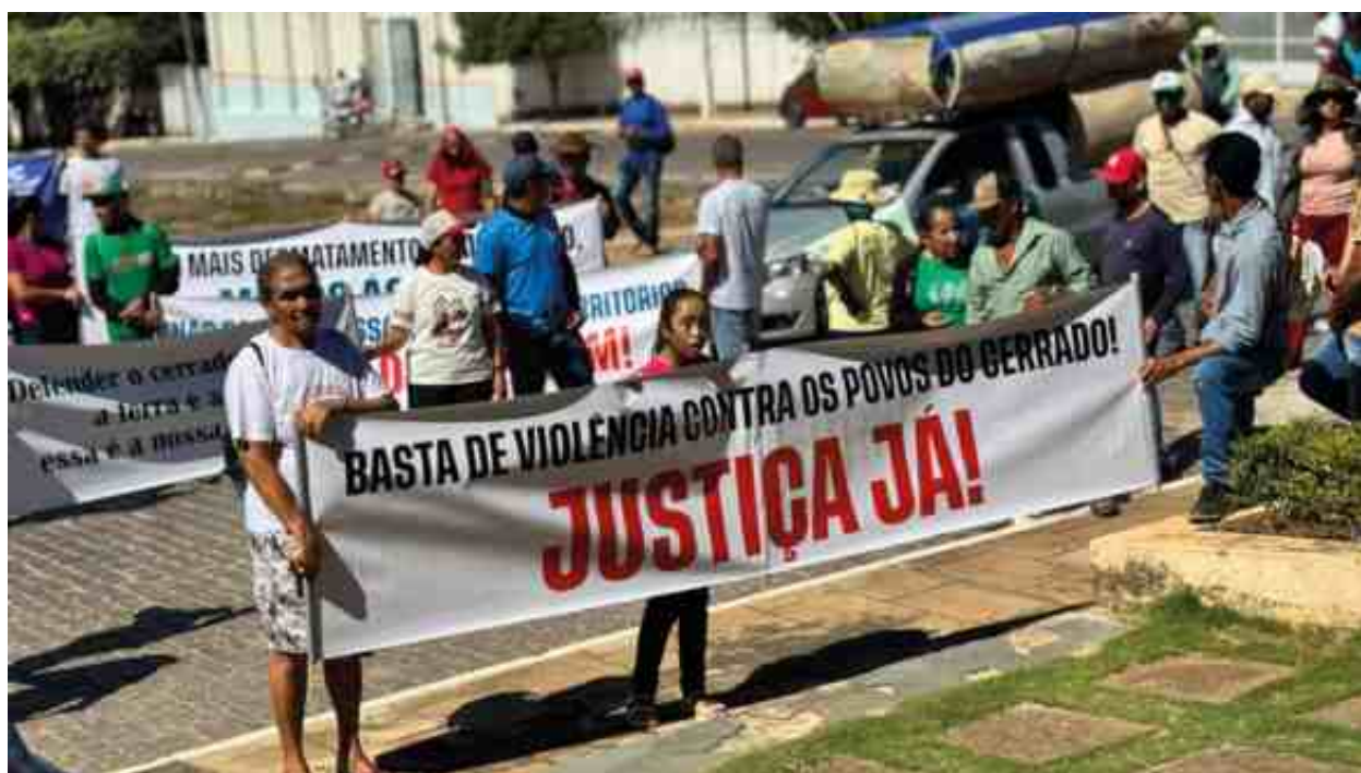
Manifestação em Coribe (BA), em maio de 2025, em defesa das comunidades de Fundo e Fecho de Pasto e pela liberdade dos fecheiros e fecheiras de Correntina presos injustamente.

Para isso, sugere-se uma atividade de leitura, a qual está vinculada ao campo de atuação da língua portuguesa, campo da vida pública, que explora gêneros textuais como: cartas, reportagens, estatutos, notícias, dentre outros. Desse modo, propõe-se o trabalho com o texto: Carta da Terra para crianças, o qual é uma versão especial do documento Carta da Terra, elaborada para o público infantil, com o intuito de alcançar a infância, acreditando que as crianças são a esperança do presente e do futuro.