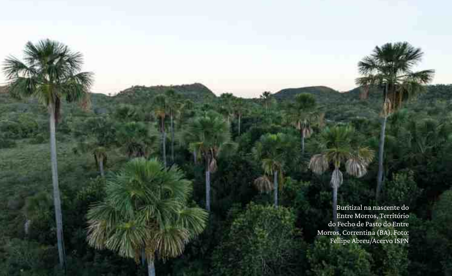
Buritizal na nascente do Entre Morros, Território do Fecho de Pasto do Entre Morros, Correntina (BA).

Orienta-se que as atividades e produções que resultem do trabalho com as unidades temáticas