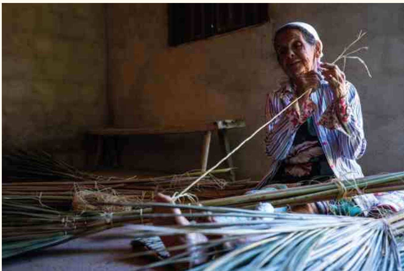
Artesã produzindo vassouras com palha de Buriti, comunidade de Forquilha, Correntina (BA).

meio da escola aos conhecimentos construídos socialmente pelos povos destas comunidades. Se por um lado, potencializa os saberes ensinados formalmente nas salas de aula, por outro, valoriza e valida os saberes construídos tradicionalmente pelos sujeitos que desenvolvem o seu modo de vida, com experiências diárias que são compartilhadas por meio das interações e vivências coletivas, nas relações familiares e comunitárias, as quais atravessam gerações e forjam saberes próprios, que se manifestam na linguagem, na cultura, nas crenças, no modo de organização, na forma de se relacionar com a natureza e com os fenômenos naturais, no jeito de conviver em comunidade, no modo de trabalhar e de proteger a vida e o território.