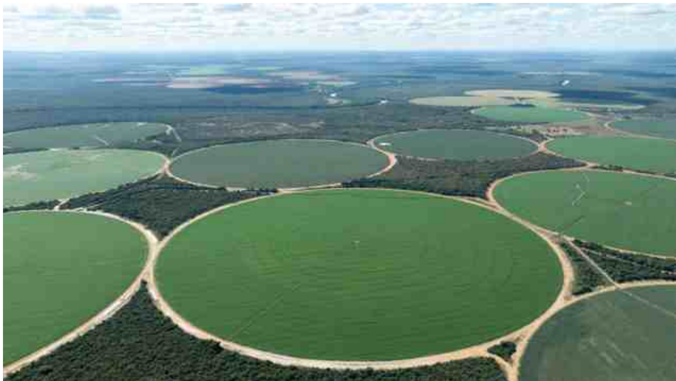
Produção de soja com pivôs central na área de recarga do Rio Arrojado, Correntina (BA).