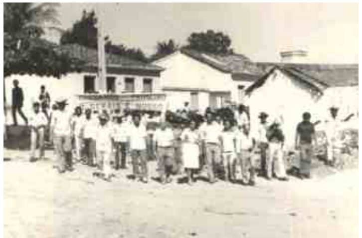
Manifestação de fecheiros nos anos 70 na Cidade de Correntina (BA).