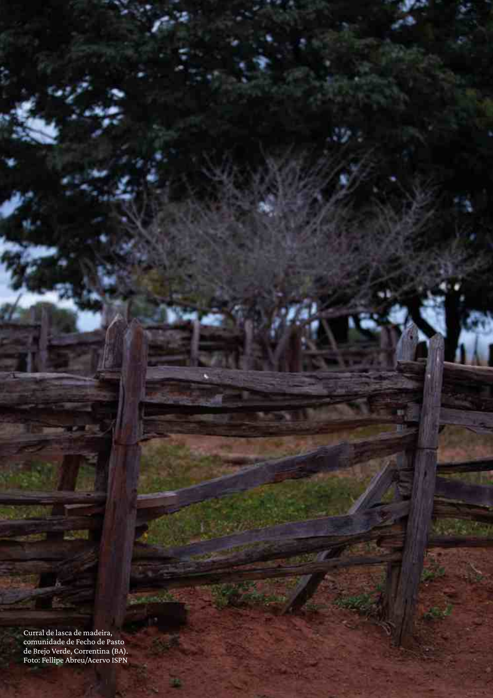
Curral de lasca de madeira, comunidade de Fecho de Pasto de Brejo Verde, Correntina (BA).