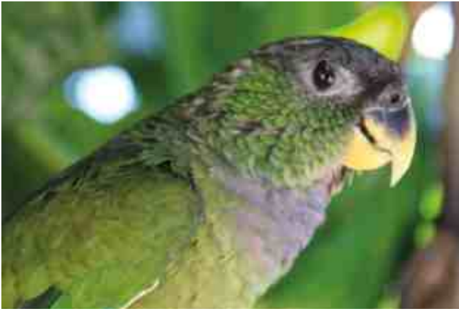
Papagaio-verdadeiro no Cerrado baiano, município de Correntina (BA).