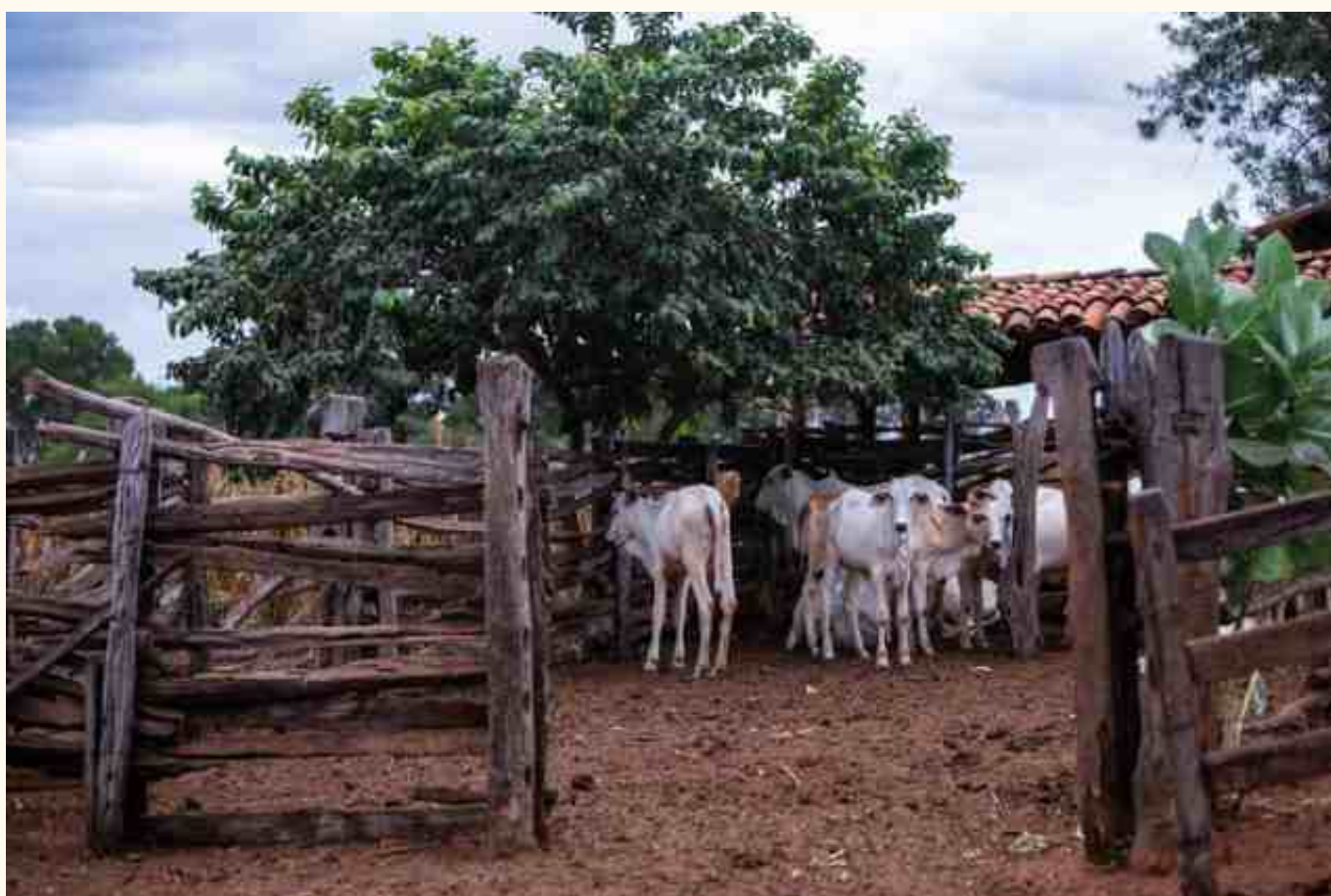
Bezerros apartados em curral de lasca, comunidade de Fecho de Pasto do Brejo Verde, Correntina (BA).

Desejamos que este roteiro didático contribua para a construção de um mundo mais harmônico e bonito.