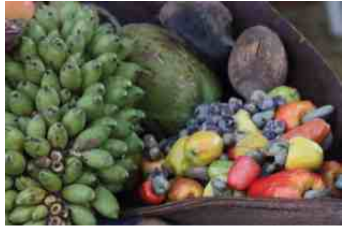
Frutos do Cerrado e da agricultura familiar, produzidos por comunidades tradicionais de Fundo e Fecho de Pasto.