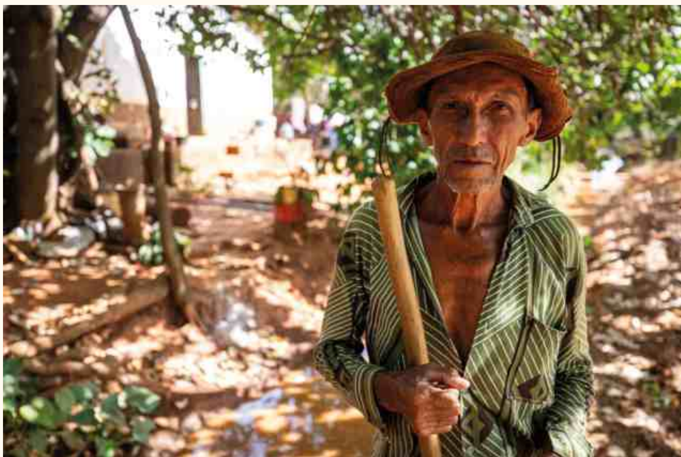
Camponês realizando a limpeza e manutenção do canal de irrigação tradicional, comunidade de Aparecida do Oeste, Correntina (BA).

Cada página deste roteiro é uma folha viva, onde se escrevem os modos de ser, de plantar, de cuidar, de celebrar. É convite para que a escola, este espaço de formação e transformação, acolha os saberes do Cerrado como parte do currículo da vida.