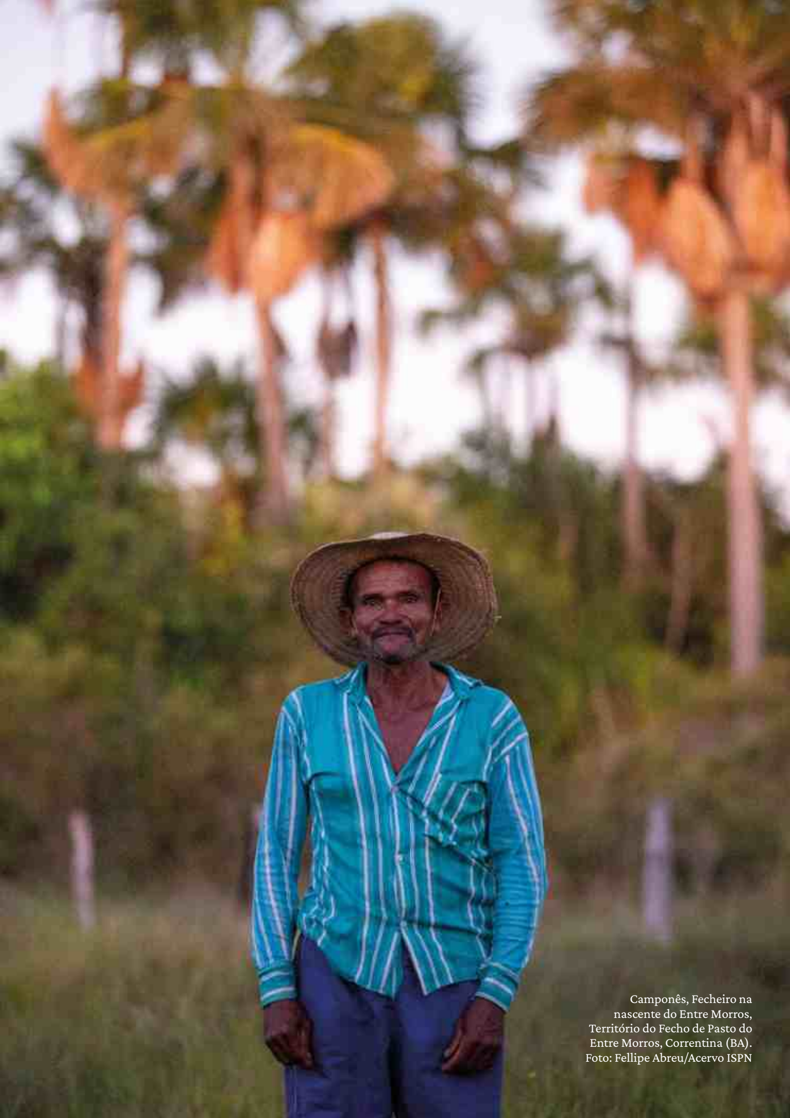
Camponês, Fecheiro na nascente do Entre Morros, Território do Fecho de Pasto do Entre Morros, Correntina (BA).