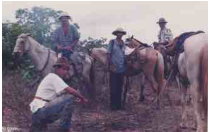
Fecheiros na labuta do trabalho no Fecho de Pasto Boi Arriba Boi Abaixo, Correntina (BA).

Com este momento inicial será possível explorar os sentidos, por meio do contato com o espaço, também será possível explorar a oralidade e a capacidade de expressar-se, de comunicar-se e de formular ideias.