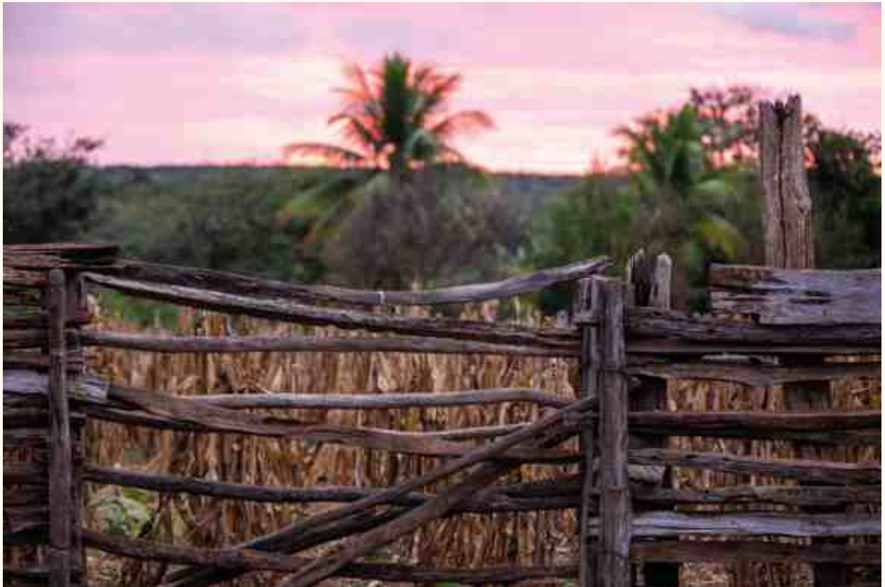
Curral construído com lascas de madeira, ao lado de roça de milho crioulo, na comunidade de Brejo Verde, Correntina (BA).