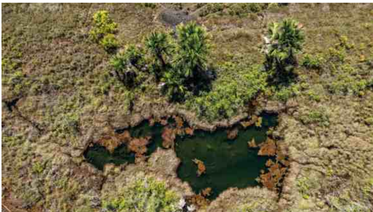
Lagoa do Ribeirão, território do Fecho de Pasto de Tarto, Correntina (BA).