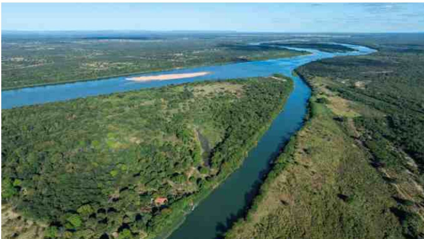
Encontro do Rio Corrente com o Rio São Francisco, divisa entre os municípios de Bom Jesus da Lapa e Sítio do Mato (BA).