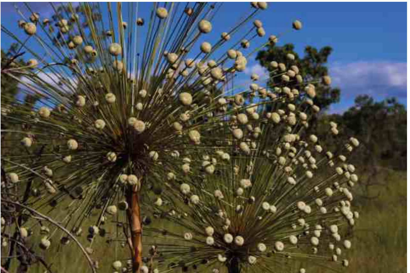
Capim-dourado no vale do rio Arrojadinho, Correntina (BA).