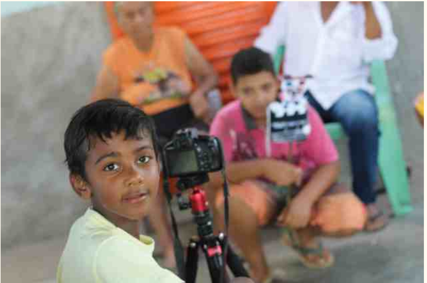
Oficina de Comunicação Popular no território de Fundo e Fecho de Pasto de Capão do Modesto, Correntina (BA)

deste roteiro didático sejam socializadas em exposições, divulgações, mostras e eventos, como forma de valorizar o empenho das e dos estudantes na construção da aprendizagem.