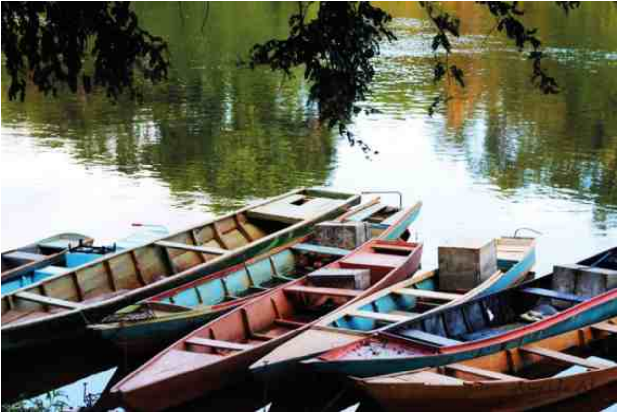
Margem do rio Corrente, em Santa Maria da Vitória (BA), formado pela confluência dos rios Formoso e Correntina.