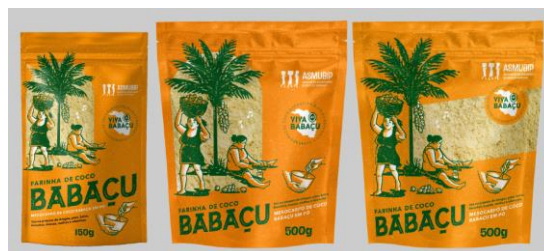
Embalagem aprovada inicialmente Proposta da embalagem com a “transparência”

Depois, discutiu-se sobre a proposta de produzir também embalagens com material mais simples (sacos plásticos), mas mantendo a mesma arte das embalagens mockup destinado para o mercado local, a fim de reduzir os custos com embalagem.