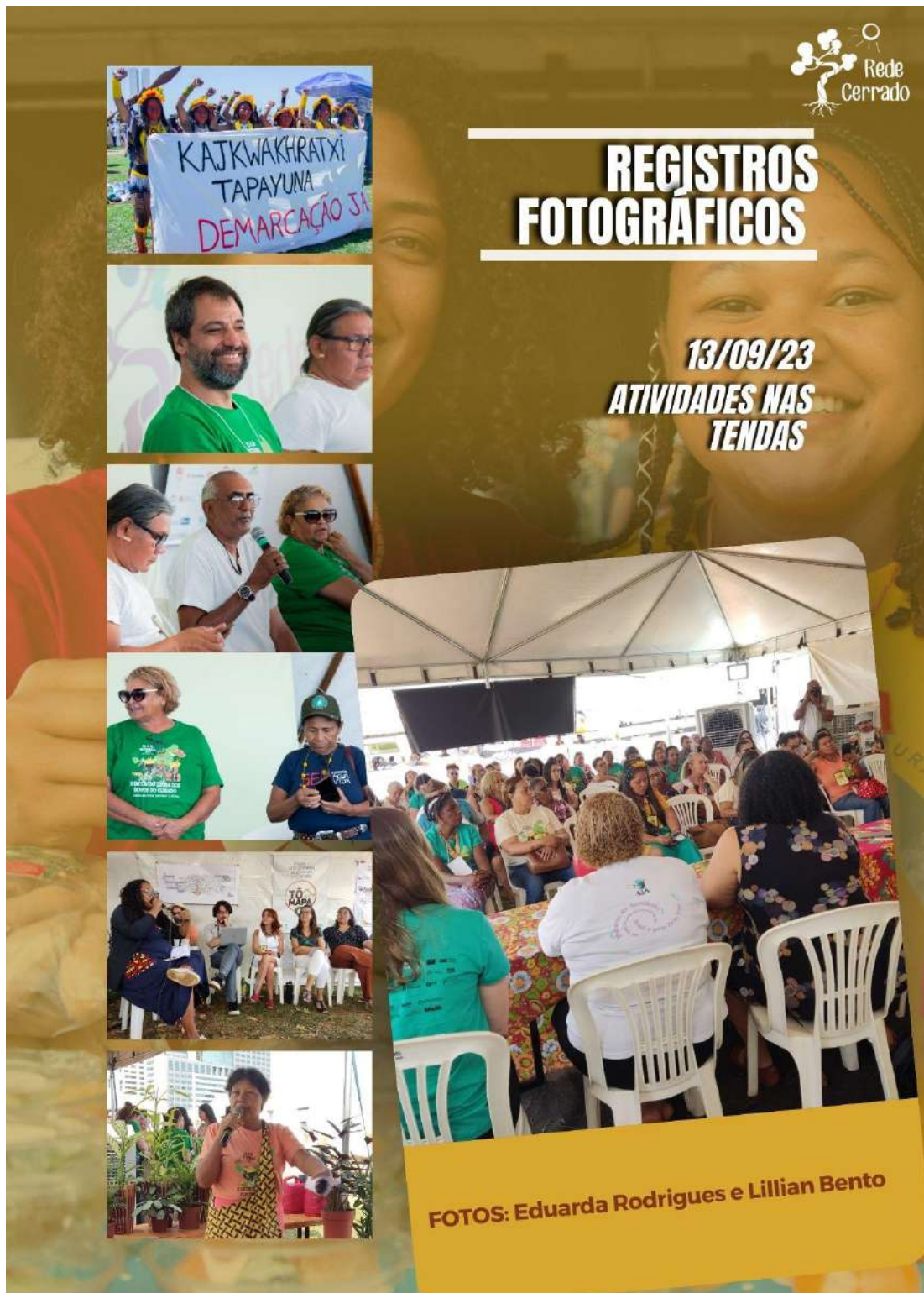
Figura 38 - Ações temáticas diversas do eixo Conhecimento

Seguem alguns registros de momentos importantes do evento: