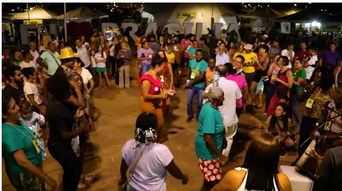
Figura 44 - Participantes celebrando!

Para os colaboradores, apoiadores e patrocinadores o X Encontro e Feira dos Povos do Cerrado , foi uma oportunidade de demonstrar compromisso com causas socioambientais e a defesa dos direitos dos povos e comunidades do Cerrado. Destacando seu compromisso com a sustentabilidade, a mitigação da mudança climática e a responsabilidade social.