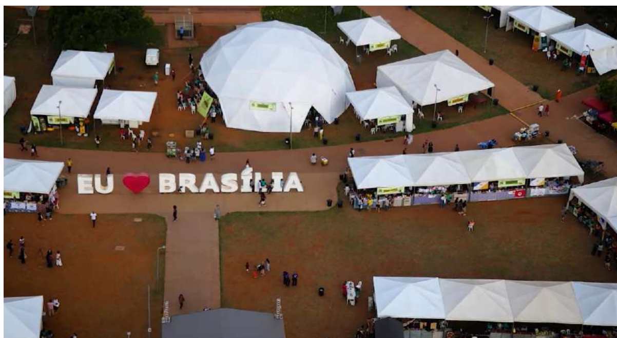
Figura 43 - Parte das estruturas do Encontro e Feira dos Povos do Cerrado

A cobertura de imprensa também foi satisfatória não só em Brasília, como nos Estados representados. Como apontamento de melhoria para próximas edições, pretendemos ampliar a cobertura colaborativa com a participação efetiva e ativa de outros veículos de mídia popular.