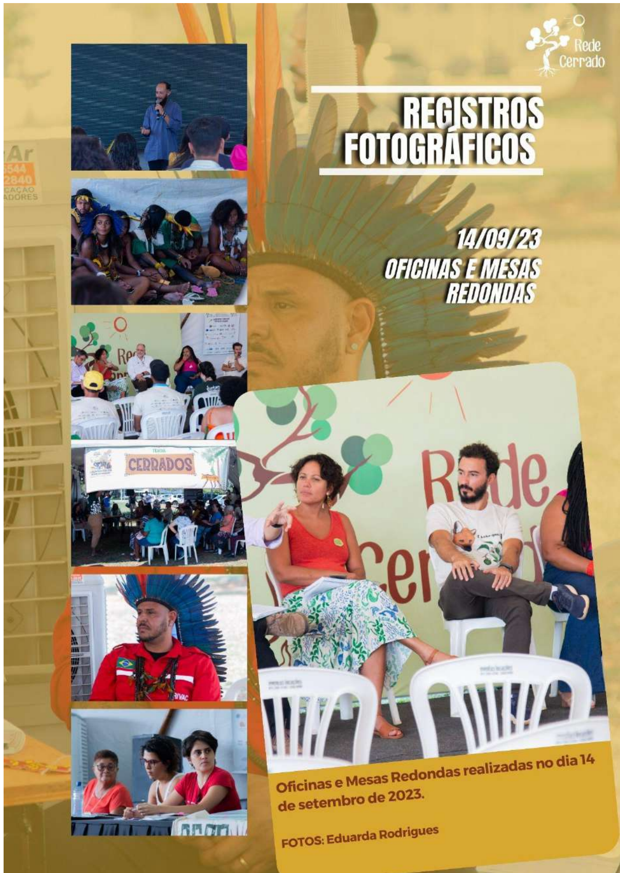
Figura 40- Ações temáticas diversas do eixo Conhecimento