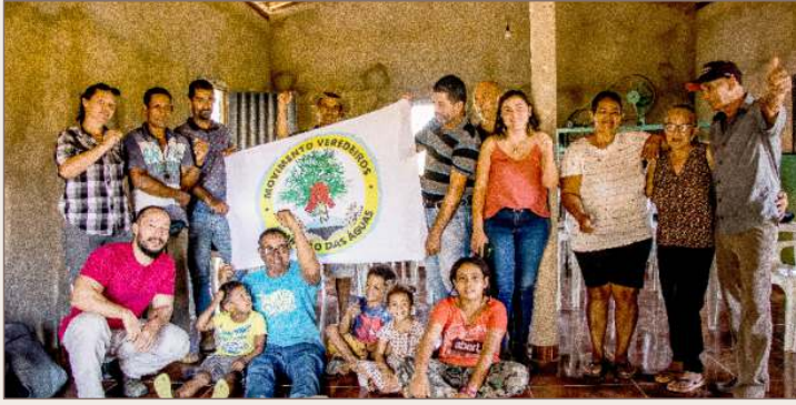
Barra do Tamboril