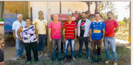
Barra do Tamboril