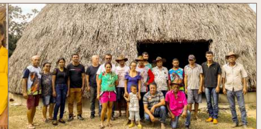
Morro do fogo

Reunião de abertura, janeiro de 2023, Comunidade Brejinho