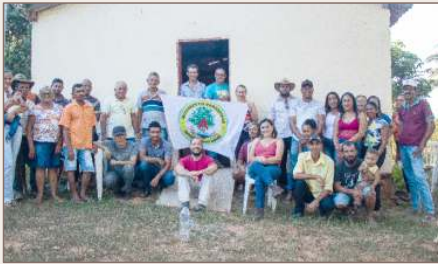
Cabeceira de Mandins