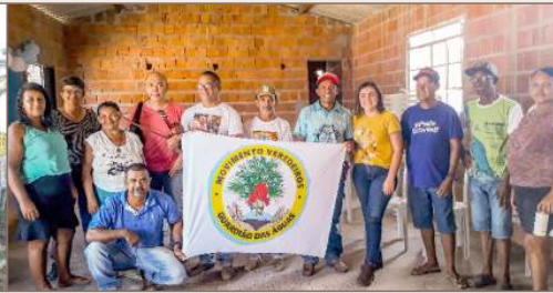
Serra das Araras