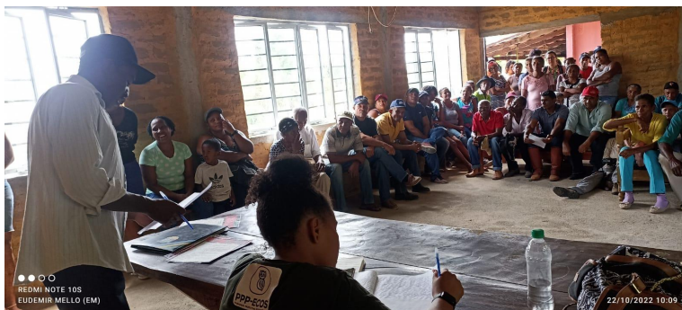
Foto da Assembleia Geral da AKMT onde se fez presente a equipe de coordenação geral do projeto.